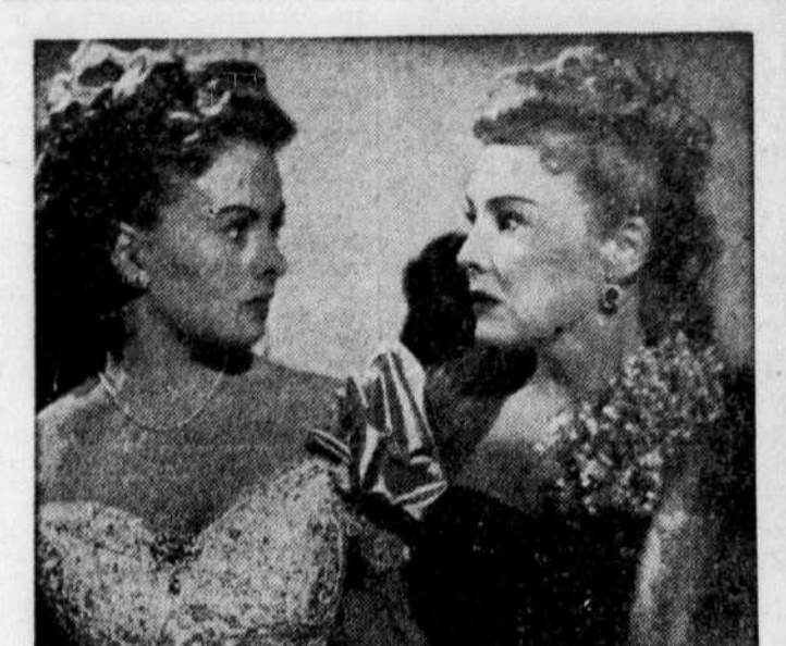
AU PALACE — Jeanne Crain et Madeleine Carroll sont les deux vedettes féminines du film "The Fan" que l'on peut voir dès aujourd'hui au cinéma Palace. C'est une adaptation d'une pièce célèbre d'Oscar Wilde.