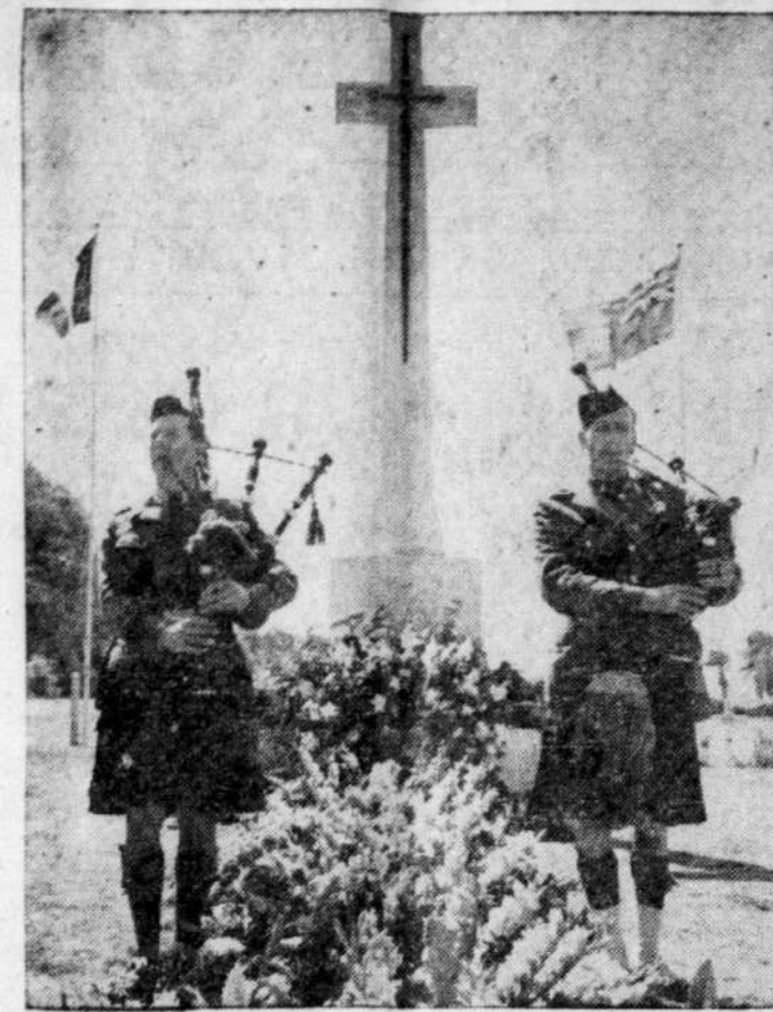
CEREMONIE EMOUVANTE AU CIMETIERE DES VERTUS — La semaine dernière, un détachement de réservistes canadiens qui avaient participé au raid de Dieppe, s'est rendu en France pour participer aux cérémonies commémoratives qui ont inauguré le 7e anniversaire de ce raid.

Mardi, le 6 septembre, les voyageurs partiront pour Montréal où ils arriveront pour le souper. Le comité d'accueil de Montréal a préparé un programme de visites et de fêtes.