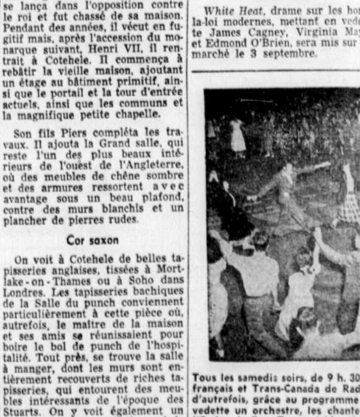
Tous les samedis soirs, de 9 h. 30 à 10 heures, les auditeurs des réseaux français et Trans-Canada de Radio-Canada peuvent revivre les veillées d'autrefois, grâce au programme "SOIREE DE QUEBEC", qui met en vedette un orchestre, les chanteurs du Cap Diamant et les jeunes de l'Ordre de Bon Tems (ci-haut) qui dansent sur la Terrasse Dufferin au milieu des applaudissements des Québécois et des touristes de passage.

2e Emprunt de guerre 3% Date d'émission: 1er octobre 1940 Date d'échéance: 1er octobre 1953 AVIS est donné par les présentes à tous les obligataires du 2e emprunt de guerre du Gouvernement du Canada 3%, Série K1, émis le 1er octobre 1940, à échéance du 1er octobre 1953, qu'en vertu des termes dudit emprunt toutes les obligations en cours sont assujetties au remboursement par anticipation le 1er octobre 1949, aux ordres de la Banque du Canada, à leur valeur nominale, contre remise desdites obligations munies du coupon de leur port 1950 et de tous les coupons suivants. Ces obligations cessent de leur intérêt à partir du 1er octobre 1949. Le Gouvernement du Canada par le BANQUE DU CANADA, agent financier Ottawa, juillet 1949