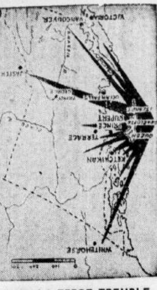
QUAND LA TERRE TREMBLE — Cette carte montre la région où s'est produit le pire tremblement de terre de toute l'histoire du Canada. Le point d'origine du séisme se trouvait dans les îles de la Reine Charlotte...

Le bureau des permis du Service de la police, présentement situé à l'annexe de l'hôtel de ville, occupera désormais le nouveau local situé au numéro 448, rue St-Gabriel, au sud de la rue Notre-Dame.