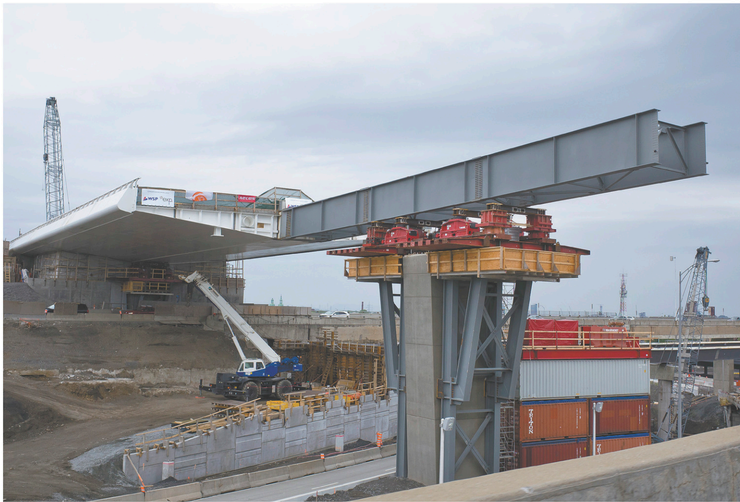
Les grandes villes de Montréal, Toronto, Calgary, Ottawa et Edmonton ont consacré un milliard de plus à leurs infrastructures que l'indice de référence du Directeur parlementaire du budget le prévoyait. Sur cette photo, les travaux sur la structure de l'échangeur Turcot.