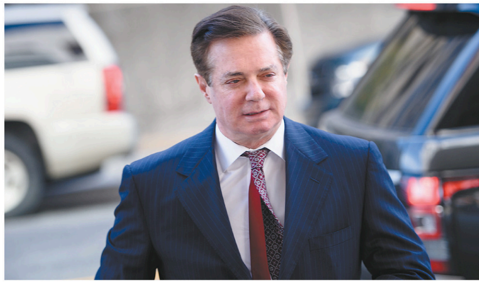
Paul Manafort, l'ex-directeur de campagne de Donald Trump, passera sept ans et demi derrière les barreaux.

Dans un échange avec des journalistes, le président américain s'est dit « très triste » pour Paul Manafort et n'a pas exclu de lui accorder une grâce. Interrogé sur cette possibilité, il a assuré ne pas l'avoir « à l'esprit dans l'immédiat ».