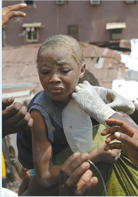
Un enfant extirpé des décombres de l'immeuble effondré à Lagos Island