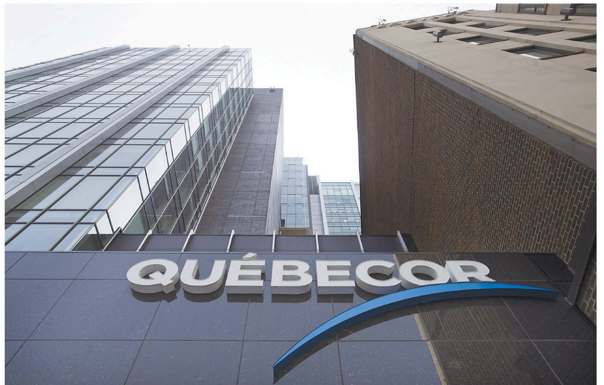
Québecor se dit en bonne position financière pour se lancer dans de nouveaux domaines, avec des liquidités de plus de 1 milliard de dollars.

À l'opposé, des régions comme l'Outaouais et l'agglomération montréalaise jouissent de tendances démographiques positives, bénéficiant d'un afflux de jeunes ménages s'y installant pour leurs études ou encore pour commencer leur carrière professionnelle. « Plusieurs proviennent des autres régions du Québec ou encore d'ailleurs au Canada, principalement de l'Ontario. » S'y greffe une concentration de l'arrivée des immigrants internationaux.