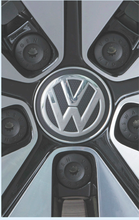
JENS MEYER ASSOCIATED PRESS