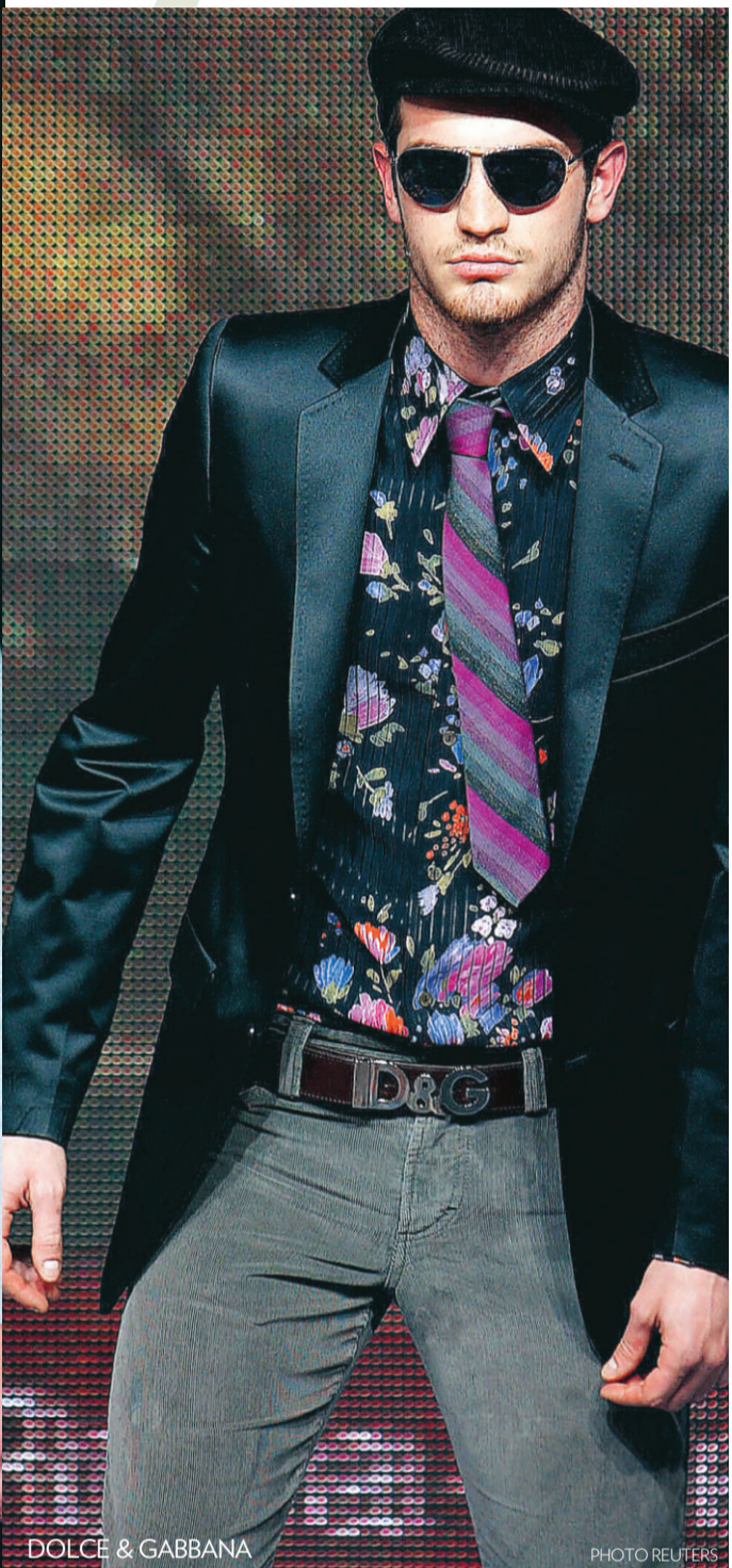
DOLCE & GABBANA