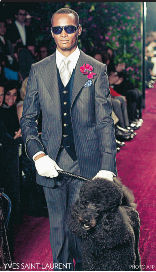
YVES SAINT LAURENT

«La mode pour homme est faite de détails raffinés qui renouvellent l'allure sans la transformer» Miuccia Prada