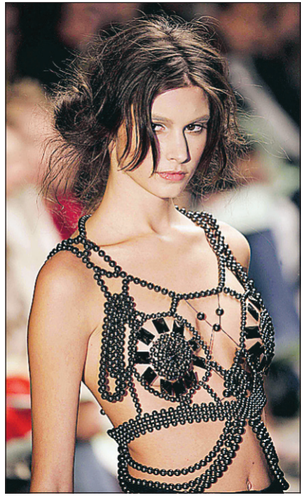
Une création de Giles Deacon, un des talents prometteurs à surveiller de la semaine de la mode.