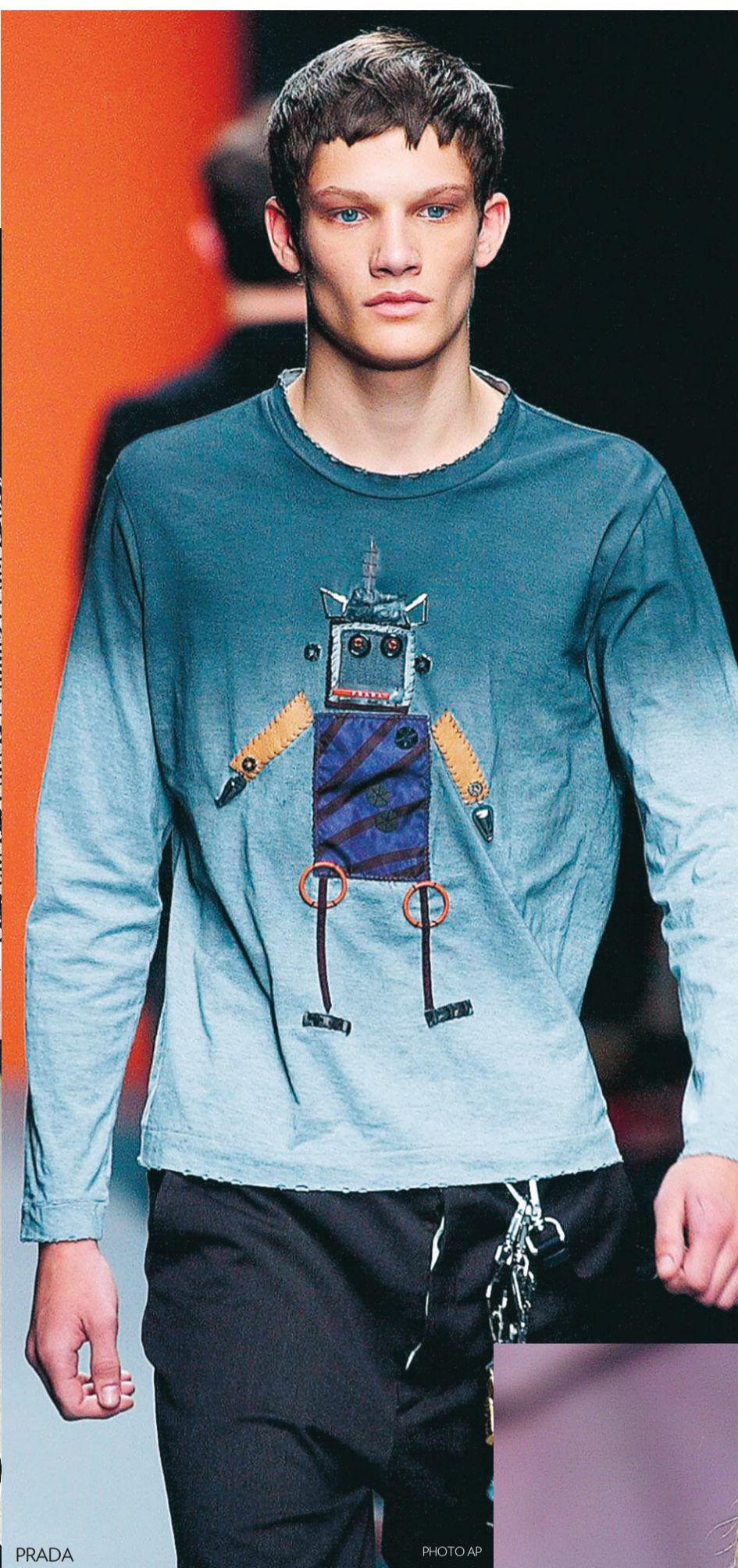
PRADA PHOTO AP