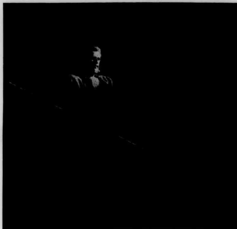
Sous les traits du Voyageur se cache Wotan, le roi des dieux du Walhalla de la tétralogie wagnérienne l'Anneau des Nibelungen , et sous le masque impénétrable de Wotan se dissimule le célèbre chanteur munichois Hans Hotter. Cet artiste chantera ce rôle dans Siegfried , troisième journée de l'Anneau , sous la direction de Joseph Keilberth. Siegfried , le Vaisseau fantôme et Parsifal sont les trois enregistrements que le Festival de Bayreuth a préparé, cette année, à l'intention de Radio-Canada. La première des trois représentations aura lieu le 24 septembre, au réseau Français de Radio-Canada.

La B.C.R.A. de Louis-Martin Tard sera mise en ondes par Hubert Aquin.