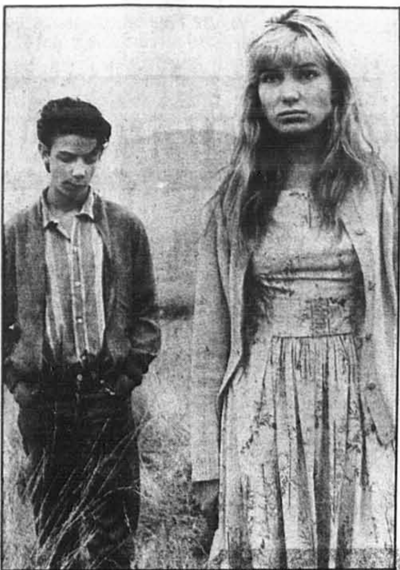
The Year My Voice Broke

■ Prenant comme base les lettres de Vincent Van Gogh à son frère, ce film documentaire illustre les principales étapes de la vie du célèbre peintre hollandais qui s'est suicidé en 1890 à l'âge de 37 ans. Il fit des études en Belgique pour devenir prêtre évangéliste puis exerça un certain ministère dans le Borinage, région minière, avant de se laisser emporter par le goût du dessin et de la peinture. Rejeté par une cousine qu'il ai-