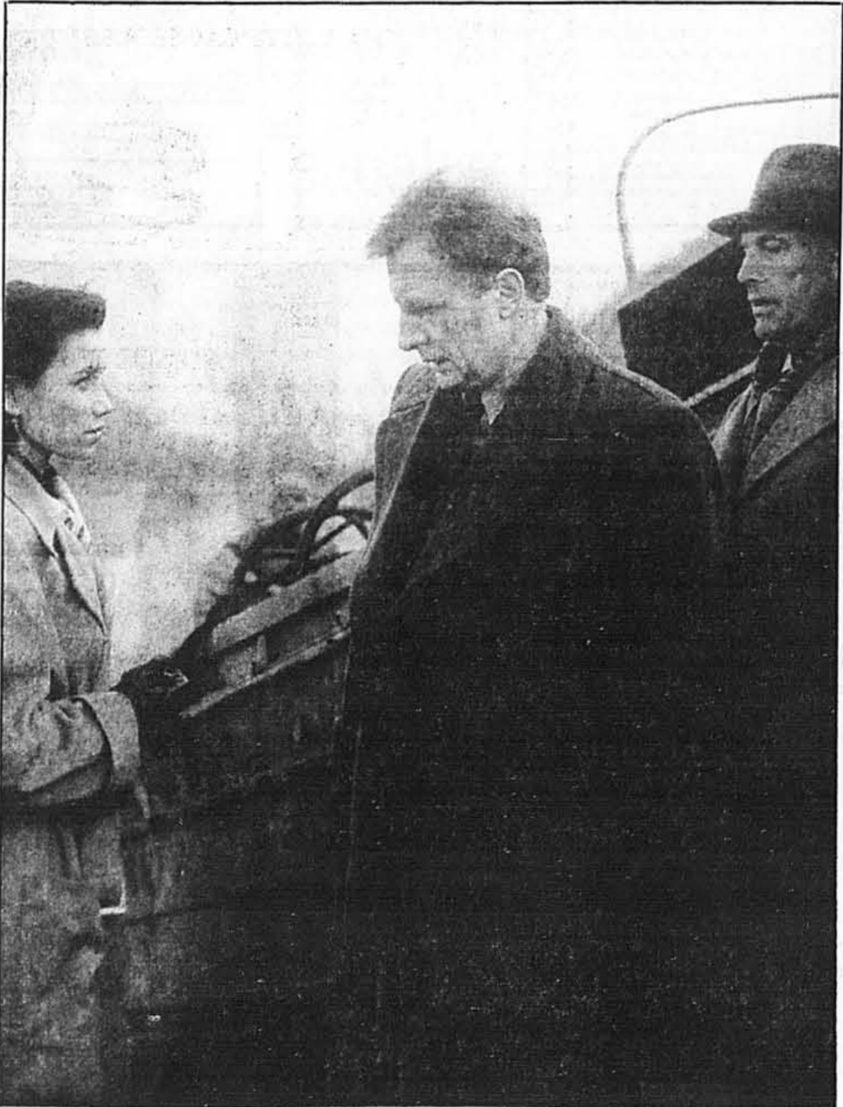
Mon Ami le traître

VINCENT: THE LIFE AND DEATH OF VINCENT VAN GOGH, au Rialto jusqu'à vendredi.