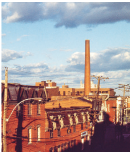
Rue de la Visitation, côté est au sud de la rue Berthier, 1974.