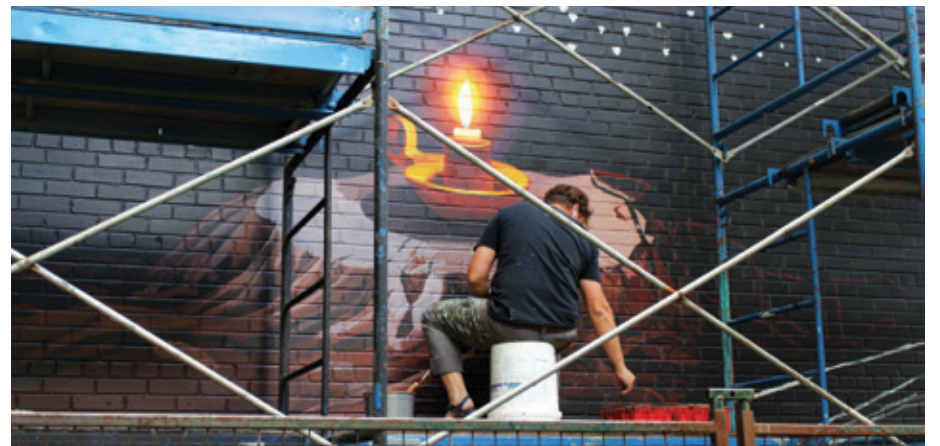
Cessez-le-feu, Philip Adams

L'art mural est souvent utilisé pour redonner vie à des lieux, car il a le pouvoir de changer les perceptions et de contribuer à transformer les usages. L'arrondissement de Ville-Marie compte d'ailleurs plus de 60 murales qui agrémentent ses espaces publics. La dernière en liste a été inaugurée le 4 août. Elle fait partie d'une série de quatre murales réalisées par MU aux Habitations Jeanne-Mance. Intitulée Les quatre éléments , cette série est l'œuvre de Philip Adams, célèbre muraliste de Philadelphie.