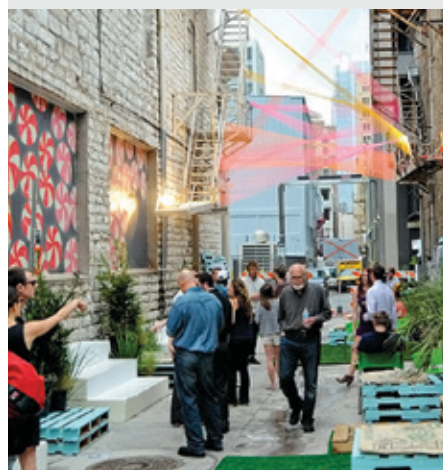
Exemple d'une ruelle aménagée dans la ville de Austin aux États-Unis

Dix ruelles du centre-ville se sont métamorphosées en installation éphémère, en août, afin de sonder les utilisateurs sur leurs idées pour les transformer. De ce nombre, trois à cinq ruelles seront sélectionnées et réaménagées en espaces publics en 2017.