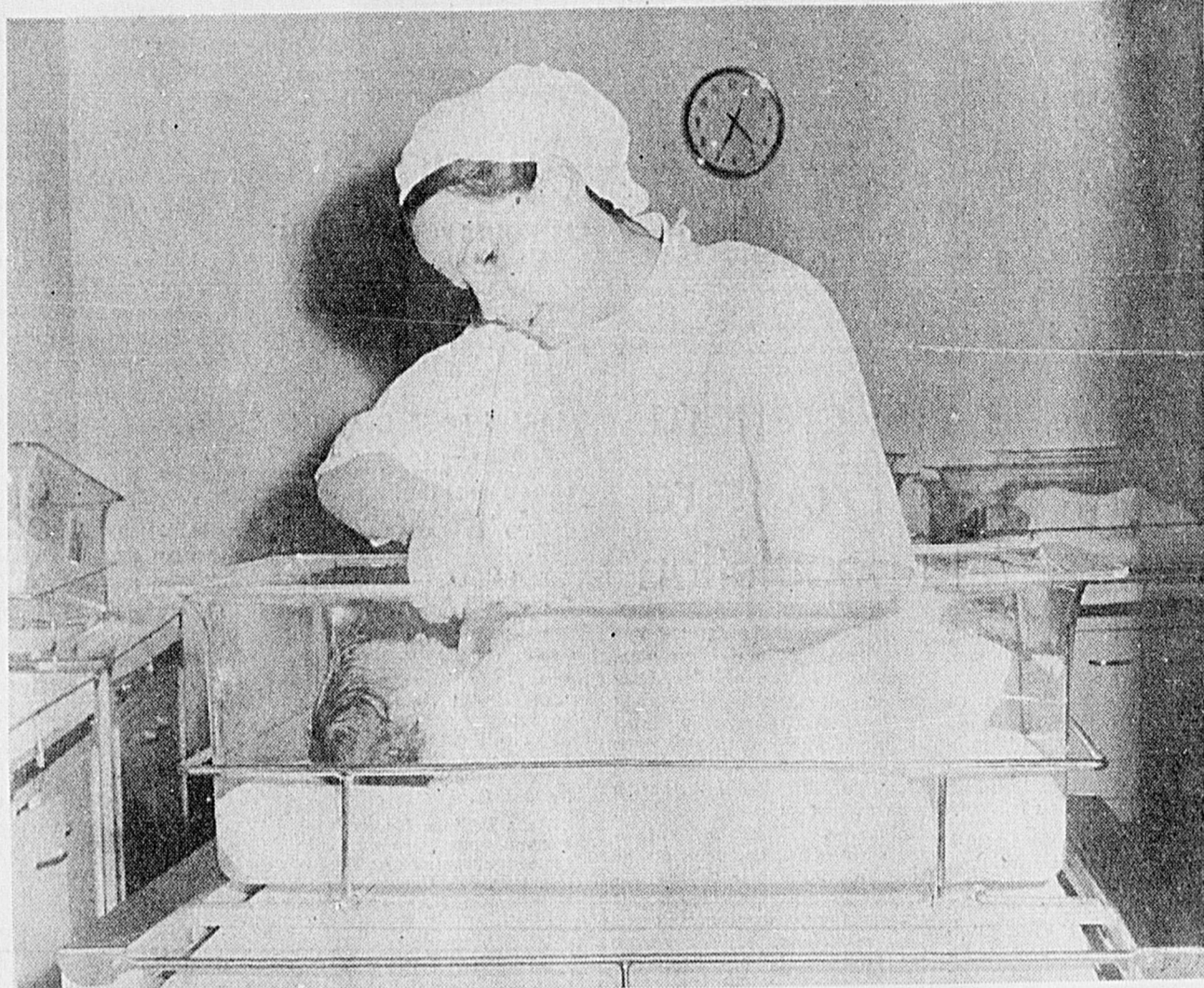
POUPONNIERE ACHALANDEE — La direction de l'Hôtel-Dieu Saint-Vallier de Chicoutimi annonce que l'hôpital a accueilli plus de 1,500 poupons en 1969. Dans la région, il n'existe pas de centres privés de maternité et les interventions à domicile des médecins-accoucheurs se font de plus en plus rares.

Pas d'épidémie pour le moment, mais comme le mentionnait le Dr Fortin, il faut être prudent. Aux premiers symptômes, il faut garder le lit, boire beaucoup de liquides et encore mieux consultez votre médecin.