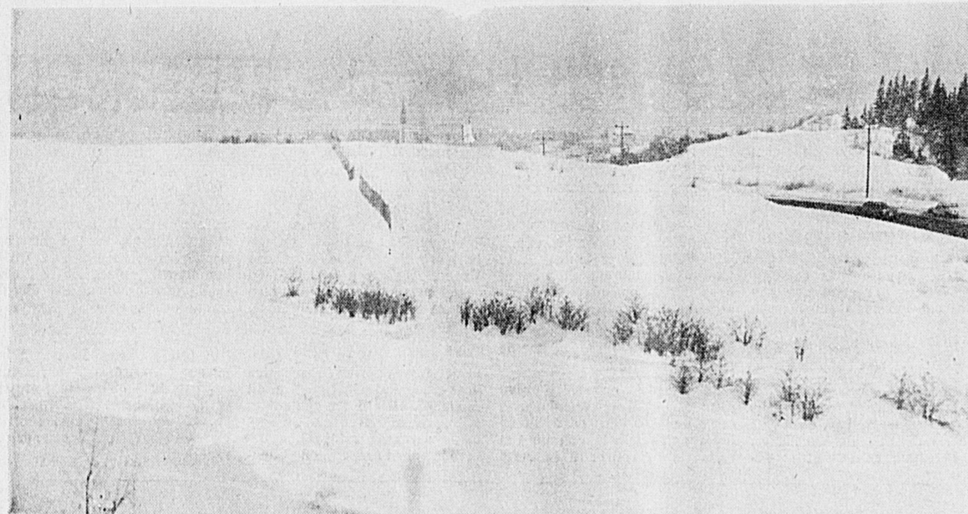
VUE SPLENDE — Cet immense terrain situé coin Dubuc et Jolliet à Chicoutimi est le site où sera élevé le futur centre de curling de Chicoutimi, après la fonte des neiges. Au