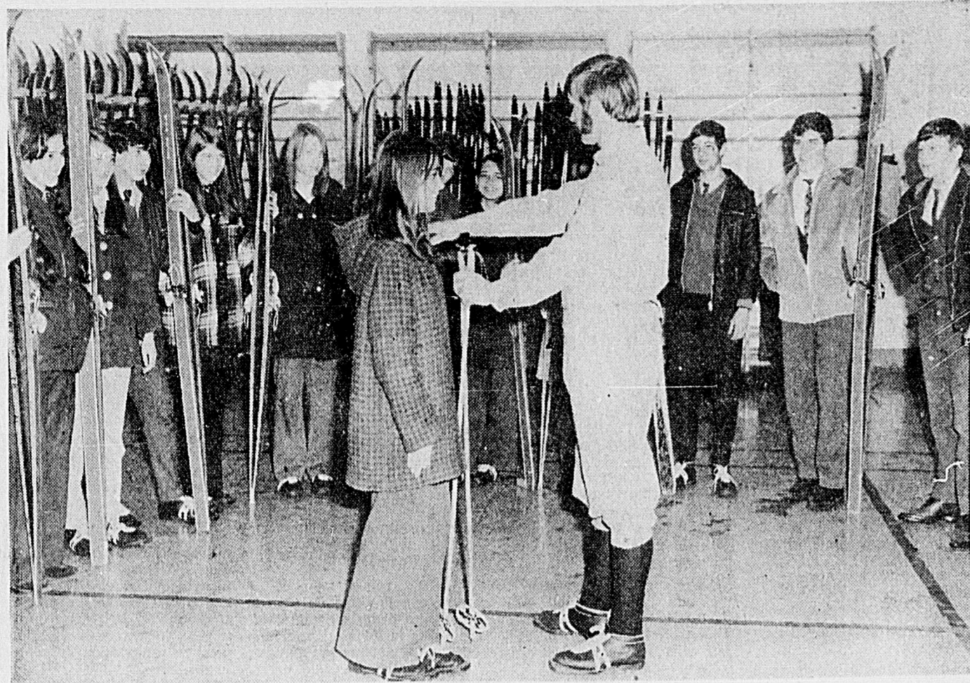
UNE CLASSE DE SKI DE FOND — La longueur des bâtons et des skis, sont deux choses importantes dans le choix d'un équipement. Au premier plan, à droite, le professeur

Ces trois joueurs seront en uniforme, vendredi soir, alors que les Aiglons d'Alma seront les visiteurs au centre Georges-Vézina.