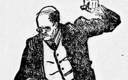
These Little Pyramids Positively Cure Piles.