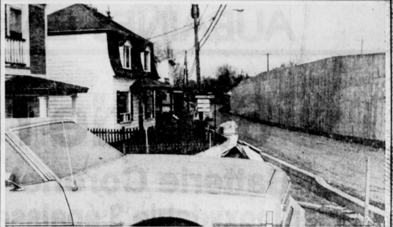
"Mur de Berlin" à Saint-Romuald

Rappelons que le coût des investissements exigés par la construction des deux usines d'épuration sera défrayé à près de 90 pour 100 par le gouvernement du Québec, puisque ces deux ouvrages seront réalisés dans le cadre du programme d'assainissement des eaux que le gouvernement a lancé en 1978.