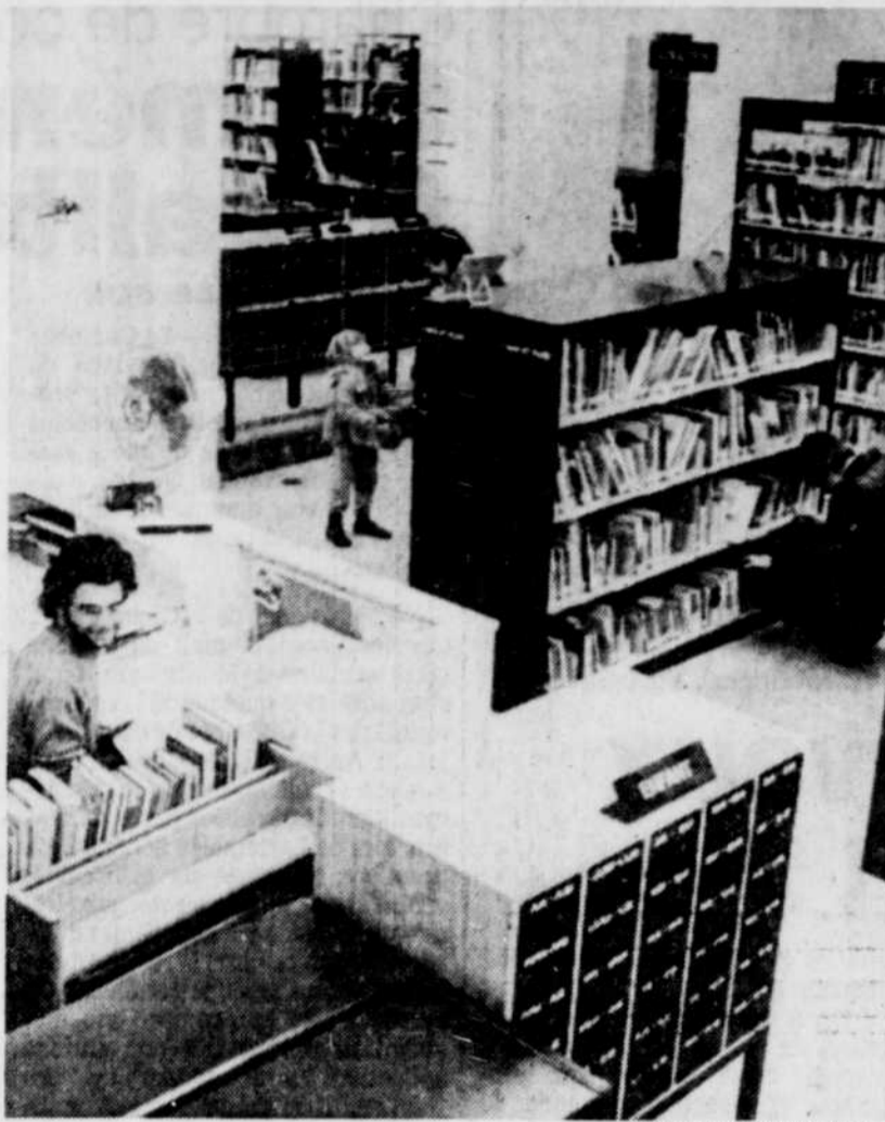
La bibliothèque de Beauport est rendue dans ses nouveaux locaux, dans l'ancien hôtel de ville de Giffard.

Enfin, la bibliothèque municipale s'avère une activité familiale privilégiée à laquelle participent en même temps parents et enfants. C'est sans doute pourquoi de nouveaux abonnés s'ajoutent constamment à ceux existants.