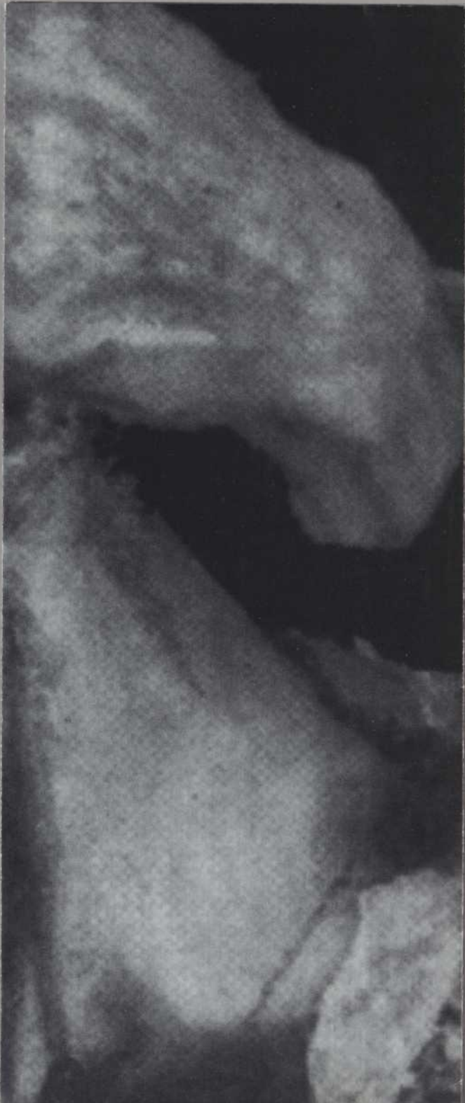
Conception graphique : Passerelle bleue - Peinture : Ylia Repine (détail)