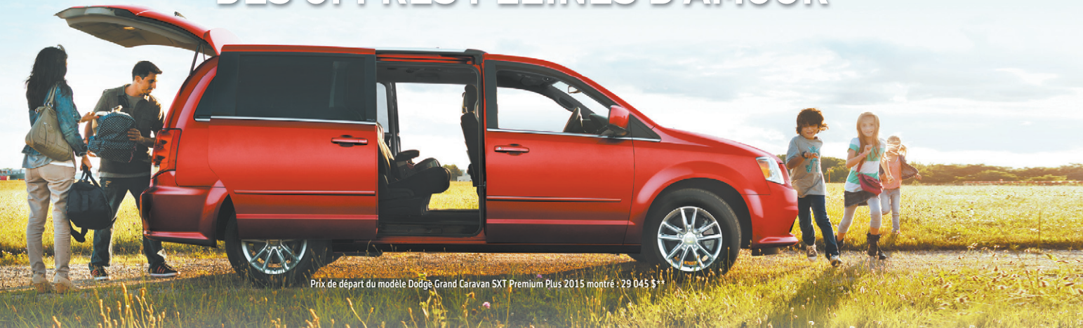
Prix de départ du modèle Dodge Grand Caravan SXT Premium Plus 2015 montré : 29 045 $**