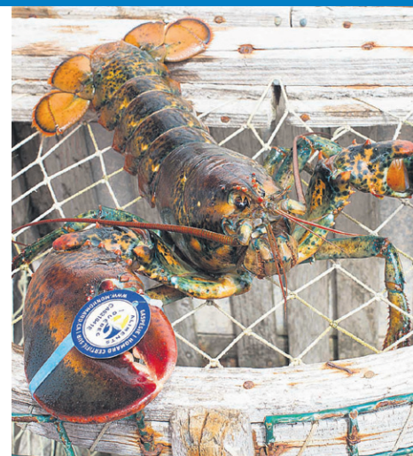
La pêche au homard gaspésien a débuté le 2 mai.

La saison de pêche, dont la durée est fixée par la loi à 68 jours, se terminera le 9 juillet.