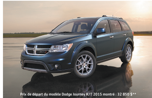
Prix de départ du modèle Dodge Journey R/T 2015 montré : 32 850 $**