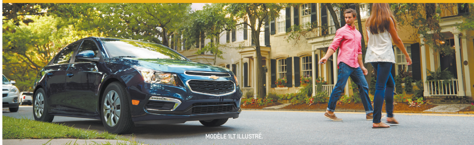
MODÈLE 1LT ILLUSTRÉ.

NOUS PAYONS VOTRE 1 ER MOIS DE LOCATION. 2