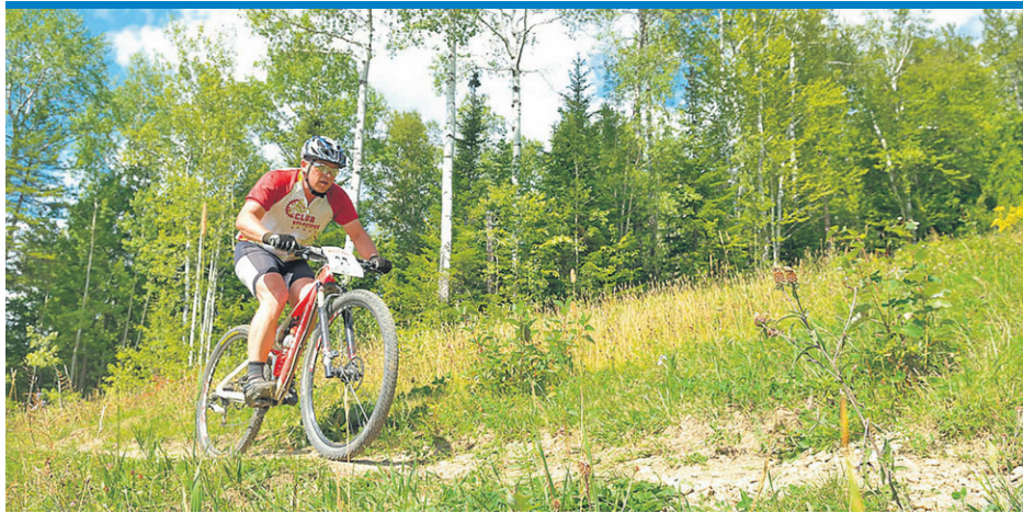
C'est maintenant le temps de s'inscrire au Club Vélocipeg.

Il est possible de s'inscrire en ligne au www.velocipeg.com , à la Boutique Sport Plein Air de Rivière-au-Renard et chez Intersport Gaspé.