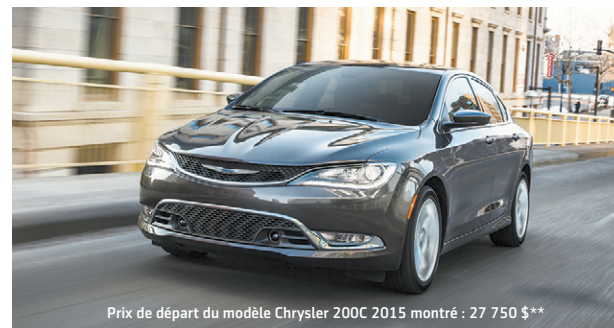
Prix de départ du modèle Chrysler 200C 2015 montré : 27 750 $**

3,49 % † JUSQU'À 96 MOIS ET AUCUN ACOMPTÉ