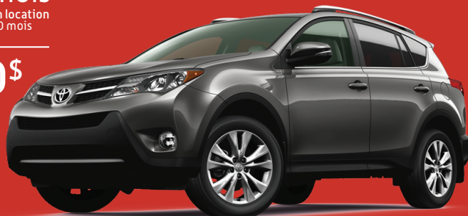
Modèle 4RM Limited illustré

279 $/mois en location 60 mois ou 26 360 $