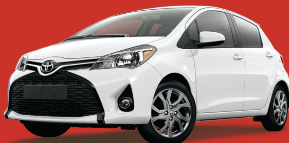
Modèle HB SE illustré

165 $/mois en location 60 mois ou 16 295 $