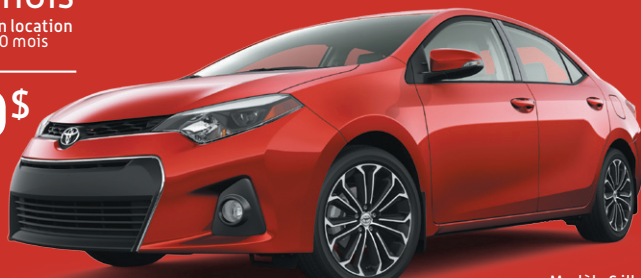
Modèle S illustré

177 $/mois en location 60 mois ou 17 720 $