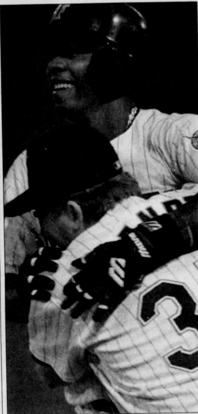
Edgar Renteria a eu droit à tous les égards.

« Nous rebondirons, comme nous l'avons fait toute la saison, a dit Bill Mueller. Nous continuerons de nous battre. Cette équipe est très spéciale. Il ne nous en faut pas beaucoup pour repartir sur la bonne piste. »