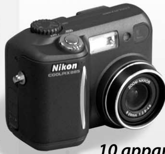
10 appareils photo numériques Nikon COOLPIX 885