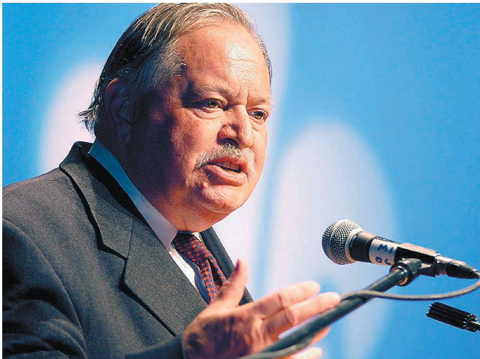
« Dans un certain sens, je regrette d'avoir utilisé une formule comme celle-là », a déclaré hier Jacques Parizeau en référence aux propos qu'il a tenus sur « l'argent et le vote ethnique » à l'issue du référendum de 1995.

Mais Jacques Parizeau « est un bon soldat », insiste Bernard Landry. Il n'est pas question de montrer la porte à celui qui avait accepté, généreusement, de lui rendre service. Il est néanmoins clair que le silence de l'incorrigible Monsieur sera bienvenu.