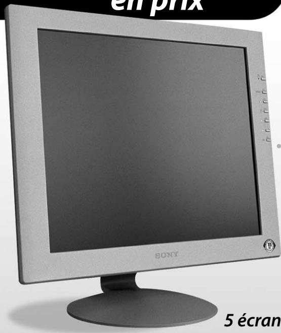
5 écrans plats Sony de 18 pouces

Adhérez à la facture Internet avant le 16 mai 2003 au www.hydroquebec.com/residentiel et devenez, vous aussi, automatiquement admissible au concours « Prenez votre portrait !* »