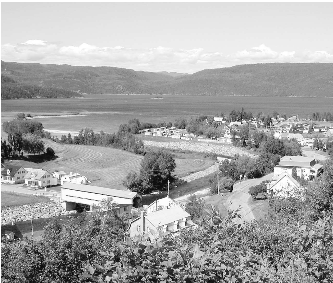
La région du Saguenay-Lac-Saint-Jean ne manque pas de charme, comme en témoigne cette vue du village de L'Anse-Saint-Jean.