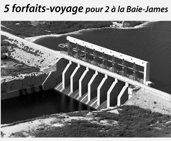
5 forfaits-voyage pour 2 à la Baie-James