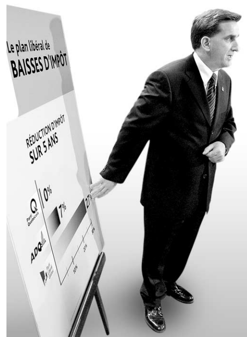
Yves Séguin

Les affiches électorales affluent à Montréal et les environs. Comme partout dans la province, d'ailleurs. Et les affiches, qui se veulent informatives, peuvent parfois semer la confusion. Comme celle-ci, de l'UFP, dans la circonscription de Gouin, qui assure que le virage à gauche, c'est possible. Sauf qu'à cette intersection, angle Saint-Denis et Rosemont, le virage à gauche est interdit... aux automobilistes.