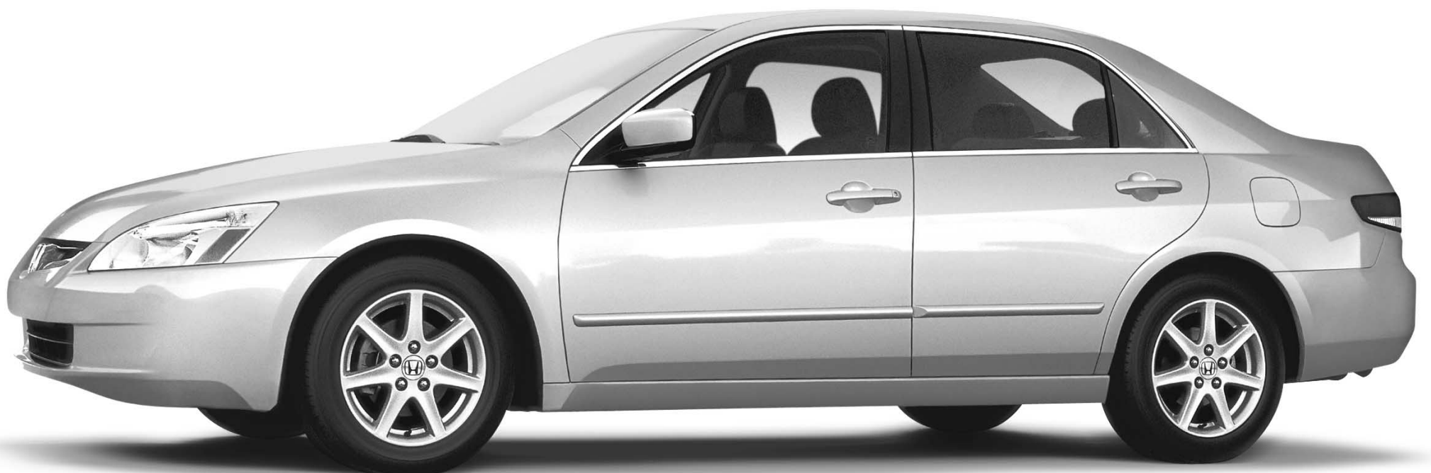
Berline Accord EX V6 2003 Illustrée