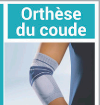
Orthèse du coude