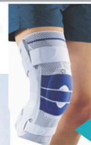
Orthèse du genou