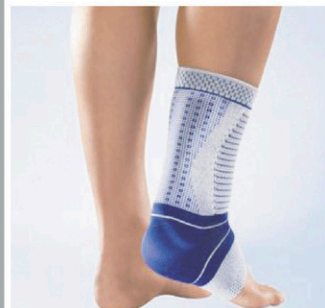
Orthèse de cheville