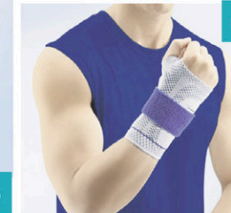
Orthèse de la main