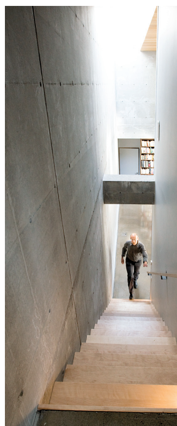
On accède à l'étage par un escalier qui longe le mur de béton et qui laisse apparaître une poutre porteuse.

loppé de béton brut n'est interrompue que par des parois de verre ou des murs en noyer massif, qui dissimulent des rangements dans la cuisine et les autres pièces.