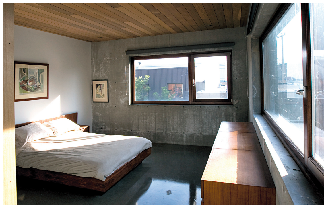
La chambre ouverte sur deux côtés offre le spectacle des toitures en pagaille du quartier.

La coquille de la maison est entièrement en béton, les sols sont constitués de poutres porteuses aussi en béton et d'une structure en bois qui permet de dissimuler les fils et les tuyaux dans l'entre-plancher. L'enve-