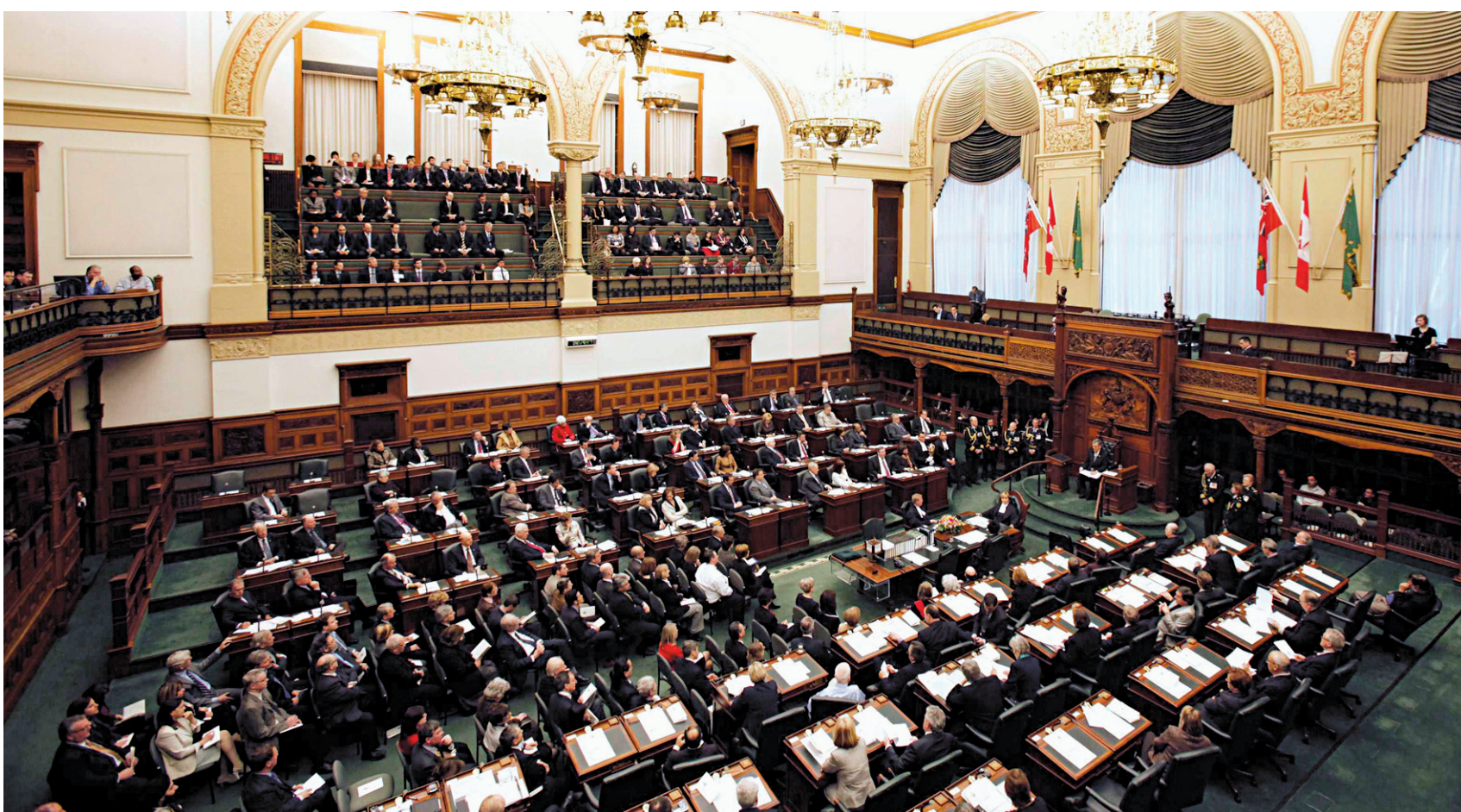
MARK BLINCH REUTERS

Les maîtres de Queen's Park, les libéraux de Dalton McGuinty, seraient parvenus à réduire l'écart qui les sépare des conservateurs.