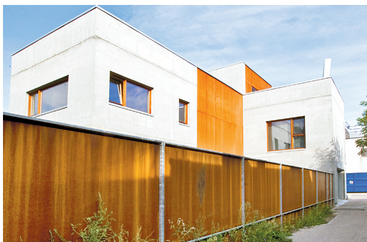
L'œuvre surprend, autant à l'extérieur qu'à l'intérieur.

Connu des Montréalais pour ses projets contemporains, très justes et chaleureux, Henri Cleinge a notamment conçu le