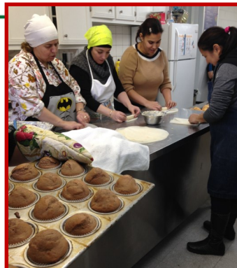
Préparation du repas