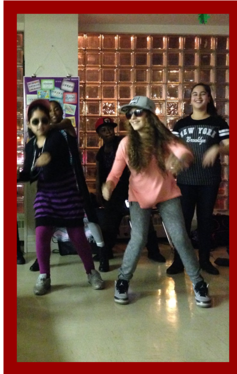
Adolescentes présentant une danse