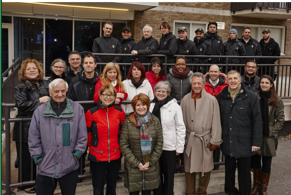
Membres du conseil d'administration et de l'équipe de travail de la CHJM