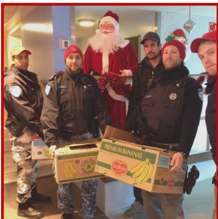
Policiers bénévoles du poste 21

Des policiers du poste 21 vont porter les 25 paniers destinés aux personnes vivant dans les tours.