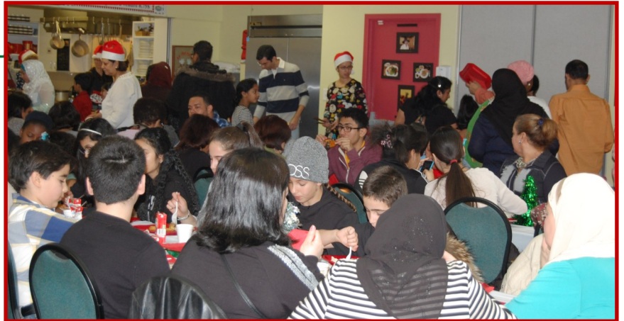
Les participants à la fête étaient nombreux