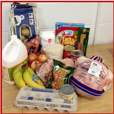
Aliments achetés par le CERF