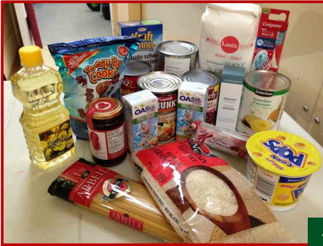
Aliments fournis par Moisson Montréal