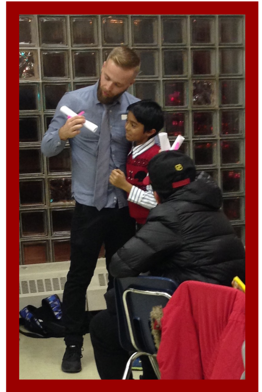
Al-Adyat se faisant féliciter pour son application dans les devoirs