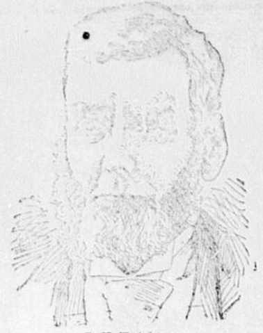
C. H. Halet vign.

Les acheteurs devraient toujours regarder à l'étiquette qui couvre les Pots et les Boîtes. Si l'adresse n'est pas 78 New-Oxford Street, auparavant 533 OXFORD STREET LONDON, ce sont de contrefaçons.