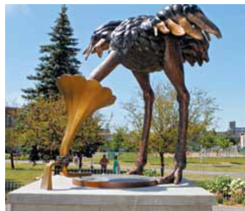
Le Mélomane , du duo Cooke-Sasseville

Afin de refléter le dynamisme culturel de l'arrondissement, les artistes se sont inspirés de La voix de son maître (His Master's Voice) , du peintre anglais Francis James Barraud, qui représente un chien attentif à la musique en provenance d'un gramophone. Le Mélomane est composé d'un socle de béton de style classique sur lequel repose une sculpture en bronze. Suggérant le caisson d'un gramophone, ce socle sert d'assise à une autruche géante en bronze, qui plonge sa tête dans le pavillon du gramophone pour s'abreuver à même une source musicale.