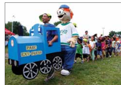
Fête de clôture du centenaire au parc Howard, le 3 juillet.

Vous avez apprécié l'œuvre d'art numérique qui a illuminé les verrières monumentales de la Gare-Jean-Talon toutes les nuits, du 20 novembre au 5 décembre, redonnant vie en images et en lumière à ce lieu historique. Enfin, l'un des plus beaux legs du centenaire est sans contredit la murale Cent motifs, un paysage , fruit d'une