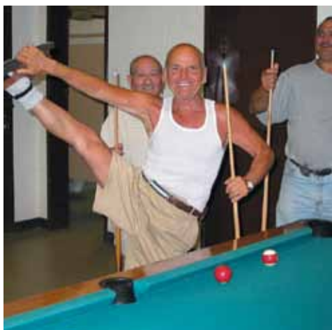
Un aîné en grande forme!

Plusieurs services adaptés aux besoins des aînés sont déjà en place dans l'arrondissement sans compter une offre sans cesse croissante d'activités culturelles et de loisirs.