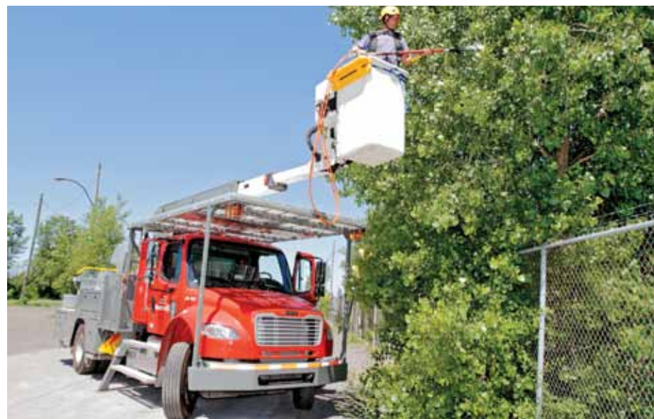
Le nouveau véhicule d'élagage de l'arrondissement

Vous avez des besoins particuliers d'élagage? Communiquez avec le 311.