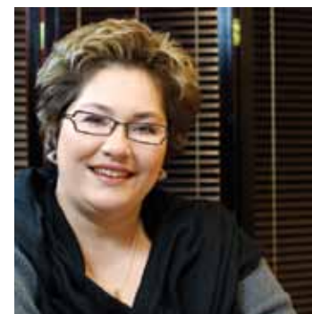
Le maire d'arrondissement