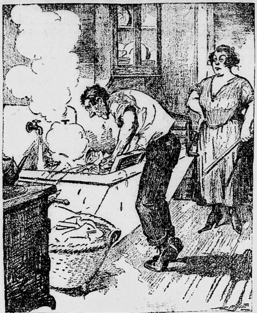
Le mari forcé de rester à la maison à cause de la grève commence à regretter d'avoir laissé le travail pour le repos.