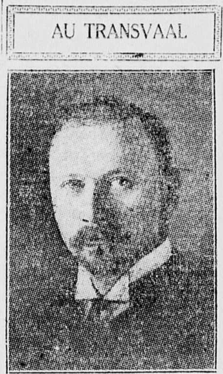
Jan C. Smuts, chef du gouvernement de l'Afrique-Union qui va aujourd'hui devant le peuple.

Le sentiment nationaliste serait tellement intense dans le pays que, dans certains cas des familles seraient divisées pour cette seule raison. C'est toujours la vieille lutte de l'hollandais et de l'anglais, qui existe depuis que la Hollande a été la Colonie du Cap à la Grande-Bretagne, en 1814. On ne sait trop quel penser de la situation actuelle, avec l'attitude du parti travailliste. C'est la première fois que les Boers anti-britanniques ont l'appui d'une section quelconque de la population anglaise.