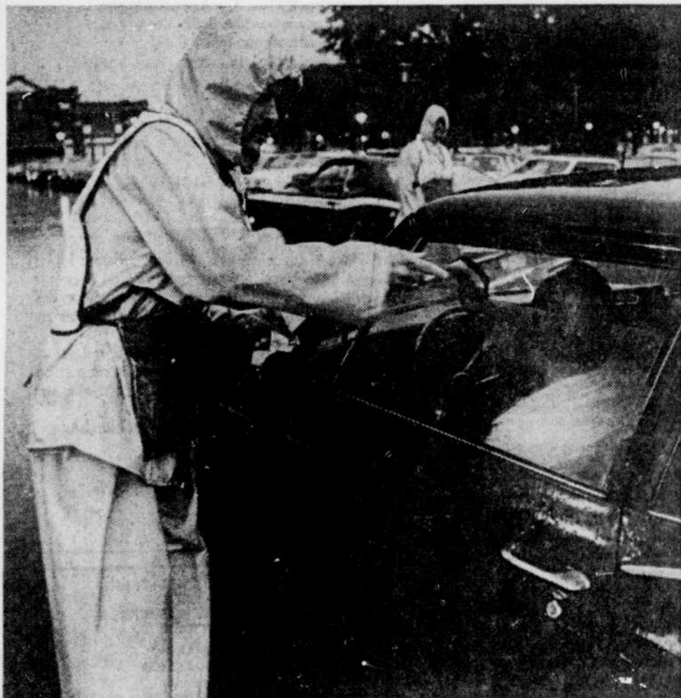
Le Soleil, André Boucher

10.30 Mire et Musique 10.45 En mouvement 11.00 La souris verte 11.15 Aventures de Colargol (c) 11.30 Les Pierrafeu 12.00 Cher oncle Bill 12.30 Le comportement animal 1.00 Dans la note 1.31 Téléjournal 1.36 Réseau-Soleil 2.31 Cinéma: Abel ton frère 4.00 Allo grenouille 4.30 Maigrichon et Gras double 5.00 Dakarti 6.00 Notre Monde - Sports - De ci, de ça - Tu parles - Mariages aujourd'hui (Nouvelles) - Nouvelles régionales CBGAT - Magazine Qui de neuf à l'est 7.00 Les Berger 7.30 Défi 8.00 Les Gens de Mogador 9.00 Rosa 9.30 Jason King 10.30 Téléjournal national et international (c) 10.50 Nouvelles du sport 10.56 Reprises des manchettes et météo 11.00 Les rois maudits 12.00 Cinéma: Quatre d'entre elles.