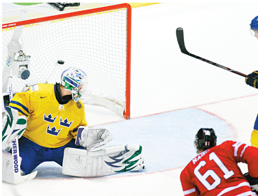
Rick Nash (61) a fait dévier ce qui allait être le but vainqueur alors qu'il restait huit minutes au troisième tiers, hier, et le Canada a battu la Suède 3-2.

43 s peu après qu'on ait puni Burns pour obstruction, une décision qui a fait sourciller. Petrasek a logé un rebond derrière Jonathan Bernier.