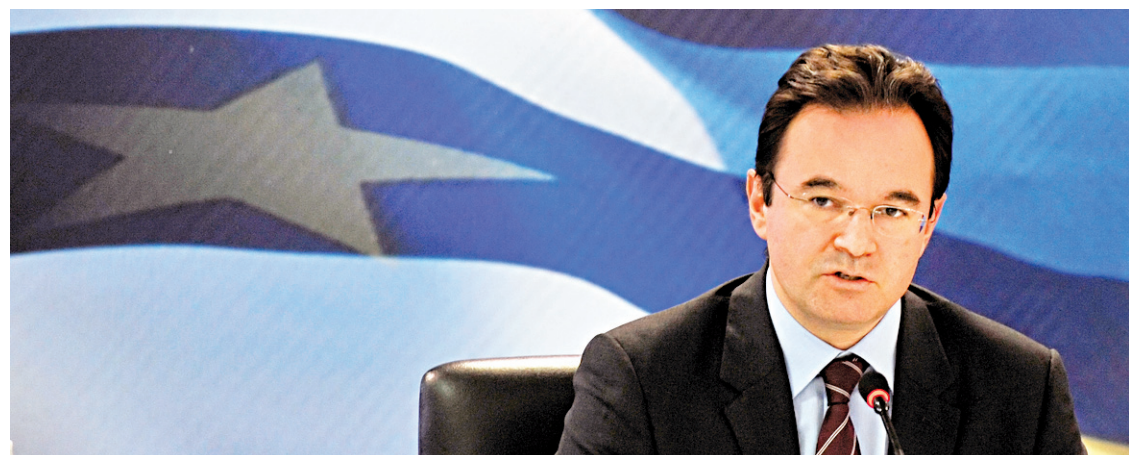
LOUISA GOULIAMAKI AGENCE FRANCE-PRESSE

Certes, le déficit public a été réduit de cinq points de PIB en un an, mais les rentrées fiscales restent mauvaises en raison de la fraude et de la