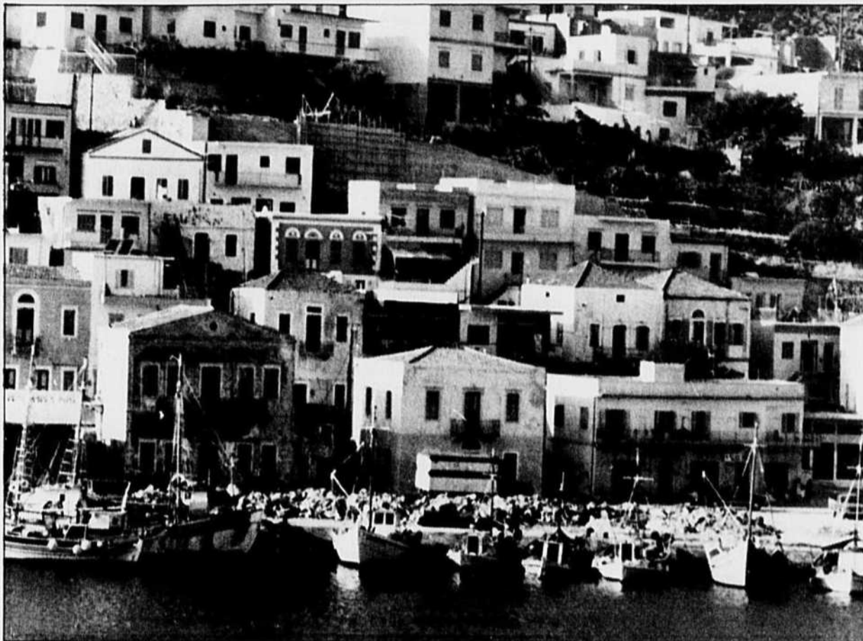
Le grecque. L'Europe se vend à prix réduit pour attirer les craintifs.

Mon enquête auprès de divers professionnels du voyage m'a permis de constater que l'Europe restera une destination populaire au cours de la prochaine saison. Certes, le nombre de sièges sur Paris aura quelque peu diminué mais il y aura une bonne vingtaine de vols, tant notés que réguliers, en chaque sens chaque semaine. « Paris se vend très bien », m'a-t-on dit, « et à des prix qui, toutes proportions gardées, ne sont pas plus élevés que ceux de l'an dernier. » D'autre part, des vols directs relieront en plus Nice et Lyon. À surveiller également: les soldes de sièges que des compagnies aériennes (Air Canada et Canadien par exemple) pourraient faire au cours des pro-