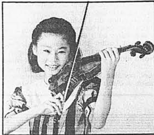
La jeune violoniste japonaise Midori, 16 ans, joue le premier Concerto de Wieniawski à l'OSM ce soir et demain soir.

Demain soir également, 20 h 30, salle Claude-Champagne, aura lieu le premier concert donné sur le gamelan offert par la République d'Indonésie à la Faculté de Musique de l'Université de Montréal. Une cinquantaine d'étudiants s'y partageront les différents instruments balinais.