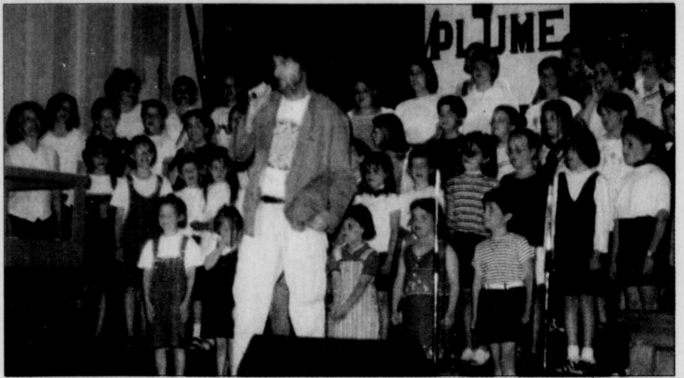
Près de 60 jeunes ont rendu hommage au parrain du 17 e Festival en chanson de Petite-Vallée, Plume Latraverse. L'événement se poursuit jusqu'au 4 juillet.

La ministre de la Culture et des Communications, Agnès Maltais, assume la présidence d'honneur de l'événement.