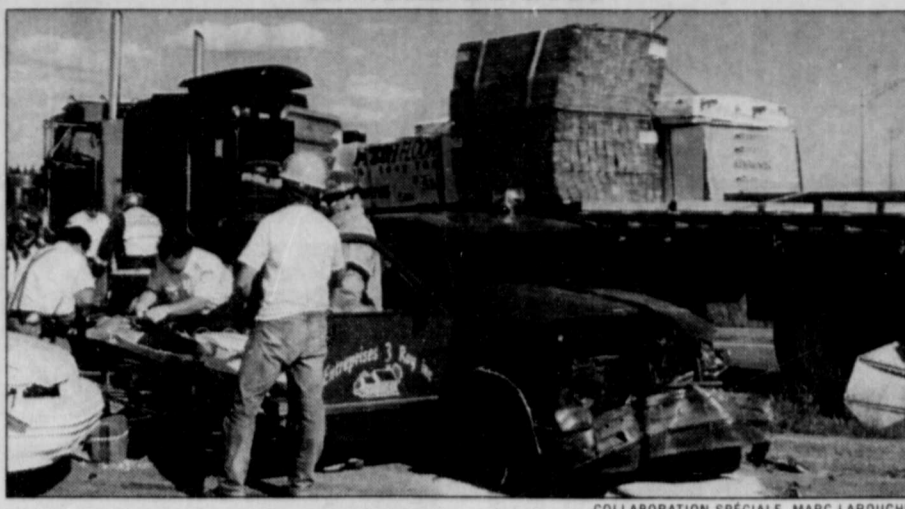
COLLABORATION SPÉCIALE, MARC LAROUCHE