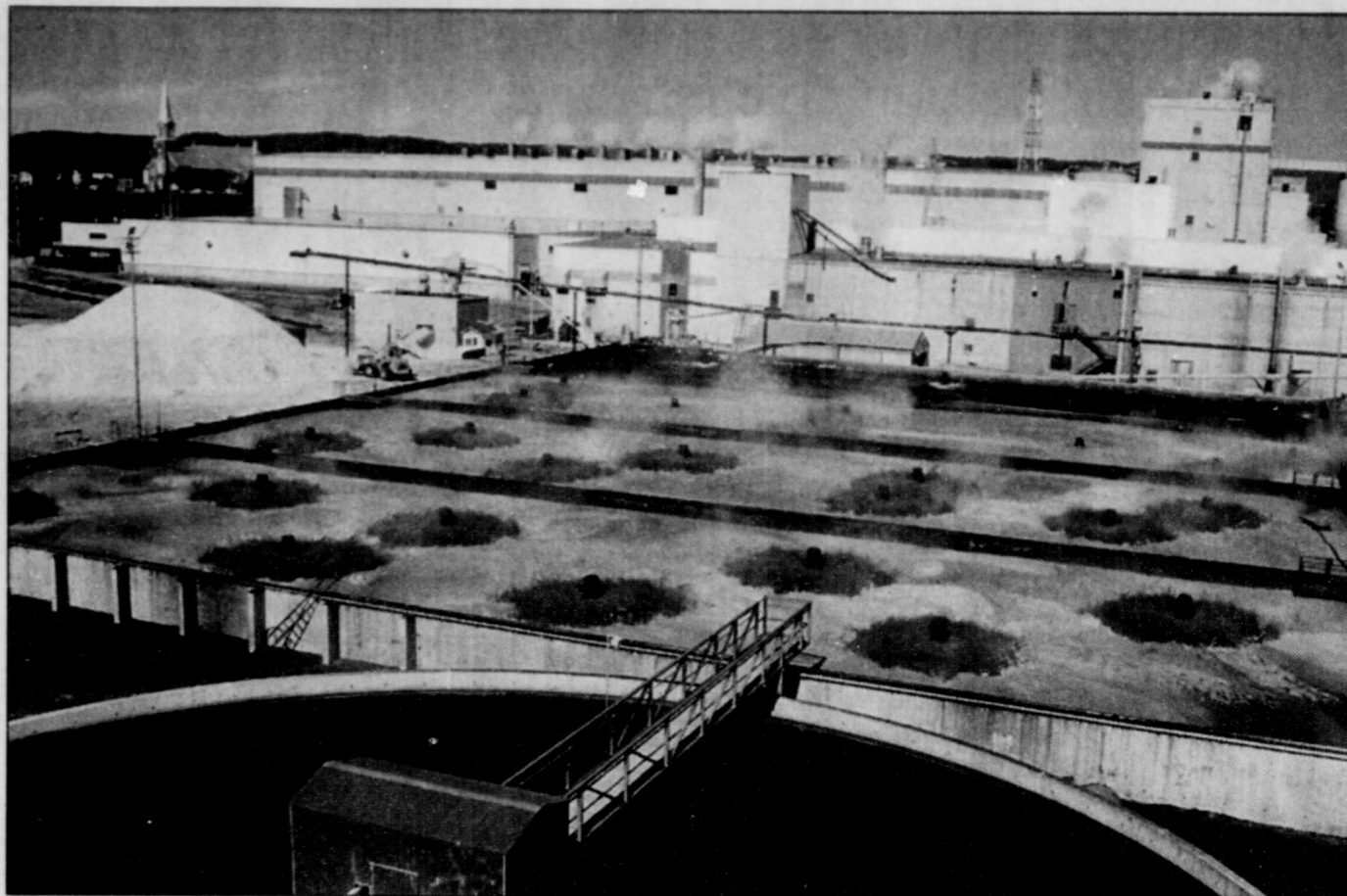
La fermeture, pour une période indéterminée, de la papeterie Gaspésia de Chandler crée de l'incertitude.

Dans les deux cas, le conseil municipal a estimé que la sanction recommandée apparaissait trop lourde en regard d'une première offense. Sans compter que les deux policiers se sont attirés les éloges, à la fois de l'otage et du directeur de la Sûreté du Québec, en poste à Matane.