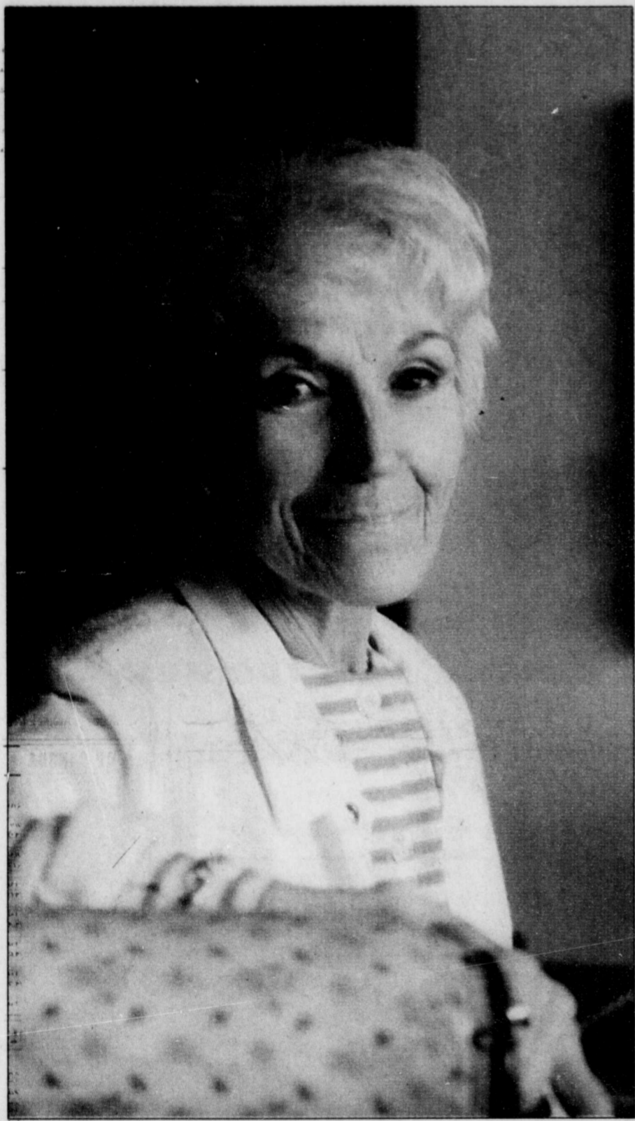
Janine Sutto ne se lasse pas du théâtre.