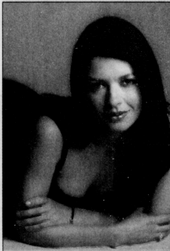
Catherine Zeta Jones