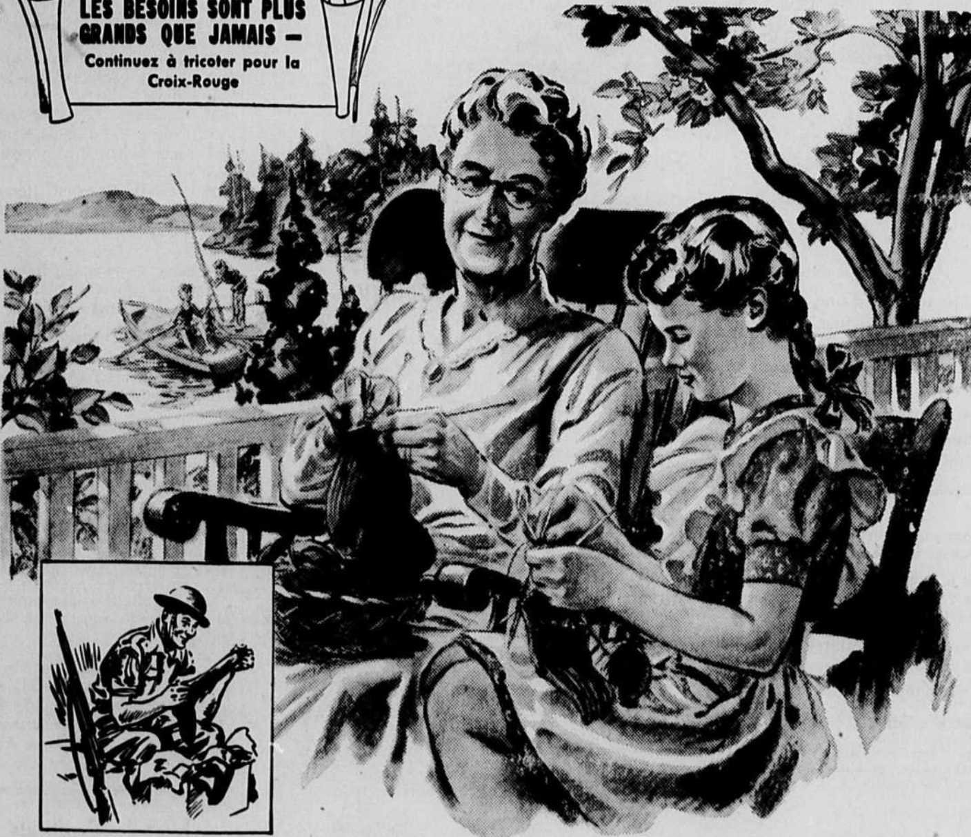
Contribution de la

LES BESOINS SONT PLUS GRANDS QUE JAMAIS — Continuez à tricoter pour la Croix-Rouge