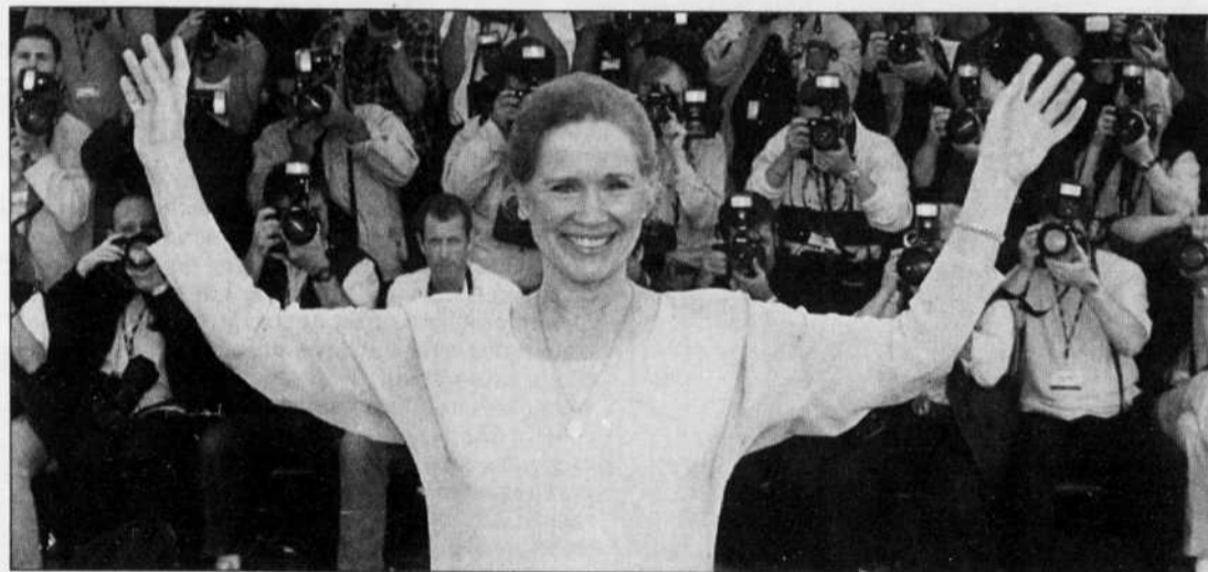
Liv Ullmann préside le jury de l'édition 2001 du Festival de Cannes.

« J'aurais voulu entendre une condamnation plus forte de la part du premier ministre, a de son côté déclaré le néo-démocrate Bill Blaikie. Qu'il dise clairement que c'est inacceptable de travailler de cette façon. Peut-être aussi le premier ministre aurait-il dû dire à quoi il s'attend en matière d'attitude de ses députés à l'endroit de leurs commettants. »