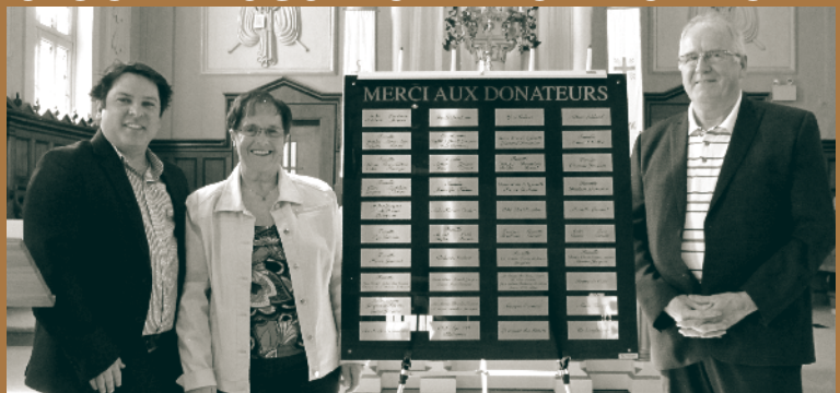
À LIRE EN PAGE 11