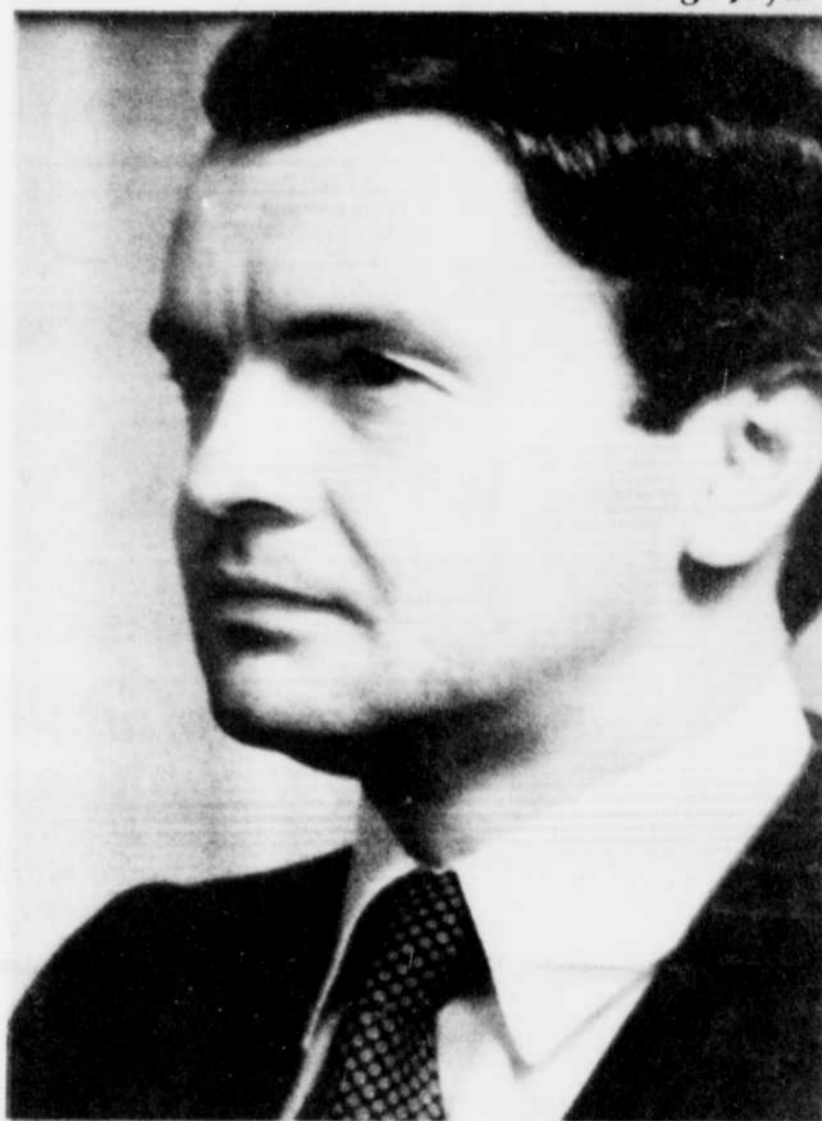
Serge Joyal, secrétaire d'Etat

Il croit plutôt qu'elles se dérouleront à l'automne. "Des élections en novembre, on a déjà vu ça au Québec", a-t-il conclu.