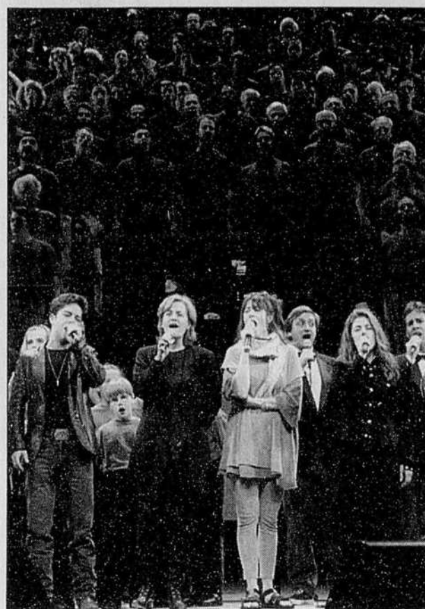
Hier après-midi à la PdA, c'était répétition générale en prévision de la méga-fête Berger-Plamondon.

« Quand on met en œuvre un programme qui n'a pas été planifié sur le plan opérationnel il surgit régulièrement des imprévus, explique Me Jacoby. Encore une fois, alors qu'on va toucher du vrai monde, et surtout dans le domaine de la santé, on voit que c'a été fait trop vite. Et c'est tellement rapide que les pharmaciens eux-mêmes dénoncent le fait qu'ils ne savent rien de ce qui s'en vient, alors imaginez les citoyens. Ça n'a pas de bon sens. »