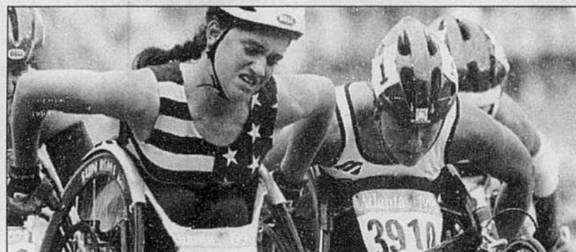
L'Américain Michael Johnson a remporté l'or hier sur 200 m en 19 sec 32; Annie Pelletier a passé la journée à savourer sa médaille de bronze; Chantal Petitclerc (à droite) a terminé 5 e au 800 m en fauteuil roulant.