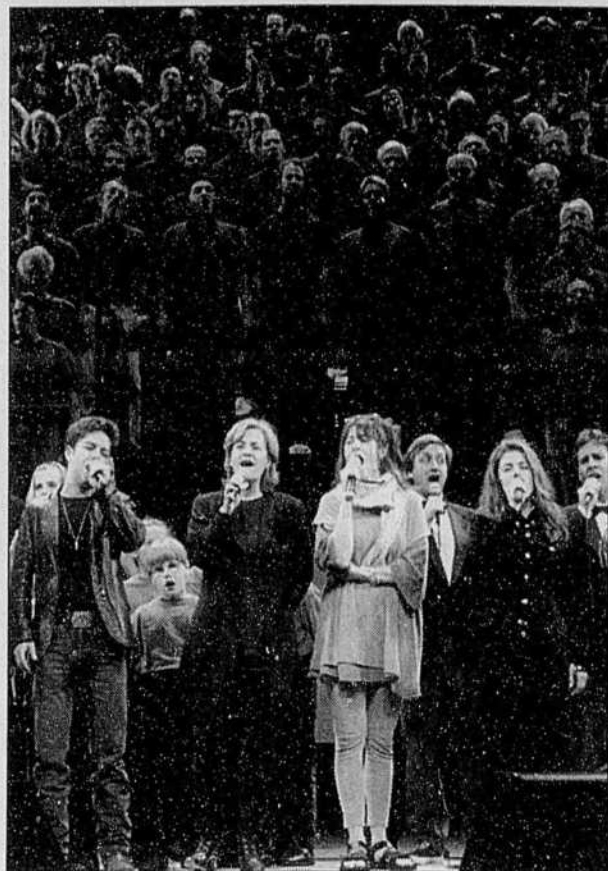
Hier après-midi à la PdA, c'était répétition générale en prévision de la méga-fête Berger-Plamondon.

« Quand on met en œuvre un programme qui n'a pas été planifié sur le plan opérationnel il surgit régulièrement des imprévus, explique Me Jacoby. Encore une fois, alors qu'on va toucher du vrai monde, et surtout dans le domaine de la santé, on voit que ça a été fait trop vite. Et c'est tellement rapide que les pharmaciens eux-mêmes dénoncent le fait qu'ils ne savent rien de ce qui s'en vient, alors imaginez les citoyens. Ça n'a pas de bon sens. »