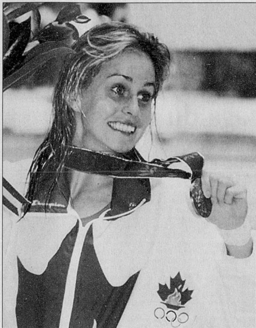
Annie Pelletier, médaillée de bronze au plongeon de trois mètres.

Tous les spécialistes en communication rencontrés hier, à commencer