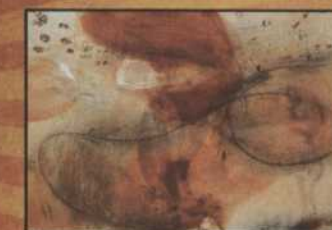
Sans titre, œuvre de Pascale Poulin

Durant les représentations de Couche avec moi (c'est l'hiver), nous vous invitons à admirer les œuvres empreintes de passion et de vivacité de la peintre québécoise Pascale Poulin. Plusieurs de ses toiles sont exposées dans le hall d'entrée ainsi qu'au foyer principal du théâtre. Ces couleurs vibrantes et riches vous ouvriront la porte sur le printemps! Cette exposition vous est présentée par la Galerie Estampe Plus et le Théâtre de la Bordée.