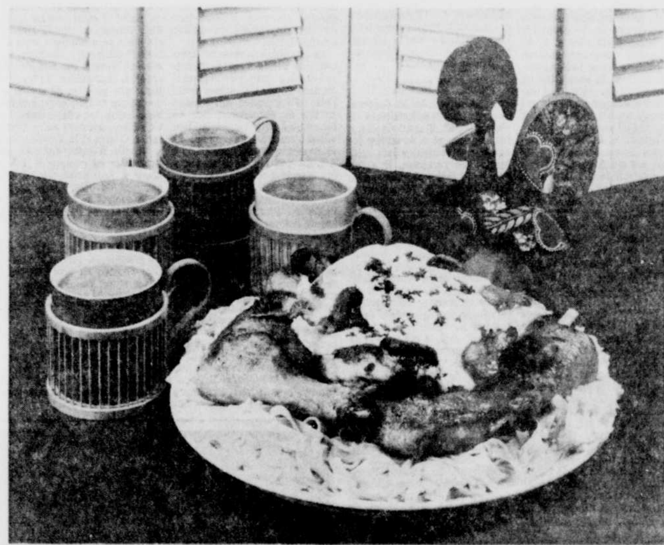
Un mets au poulet qui fera caqueter votre famille. Châtaignes et aux champignons.

Les sports d'hiver et les joyeuses randonnées avec votre famille rendent la vie bien agréable en cette froide saison. Vous pouvez conserver ces heureux souvenirs en photos: à condition de ne pas oublier votre appareil et beaucoup de films couleur.