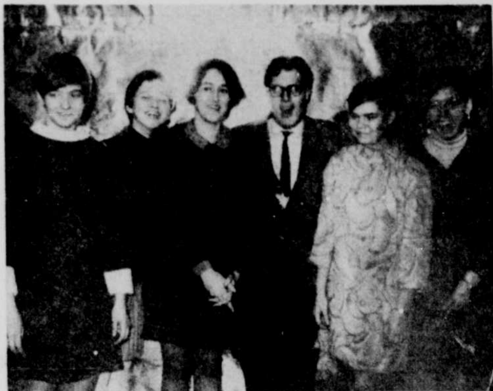
LES ÉLÈVES DU NIVEAU SECONDAIRE de Victoriaville ont célébré avec éclat, en fin de semaine, leur festival d'hiver, par de nombreuses manifestations, auxquelles une participation sans précédent a été enregistrée. Le festival a débuté vendredi après-midi, pour se terminer dimanche soir par un concours d'amateurs. Sur notre photo, cinq responsables de ce festival, qui sont de gauche à

Par ailleurs, samedi soir, les jeunes ont servi un souper à l'école Massicotte, auquel 850 convives ont participé. Il est a no-