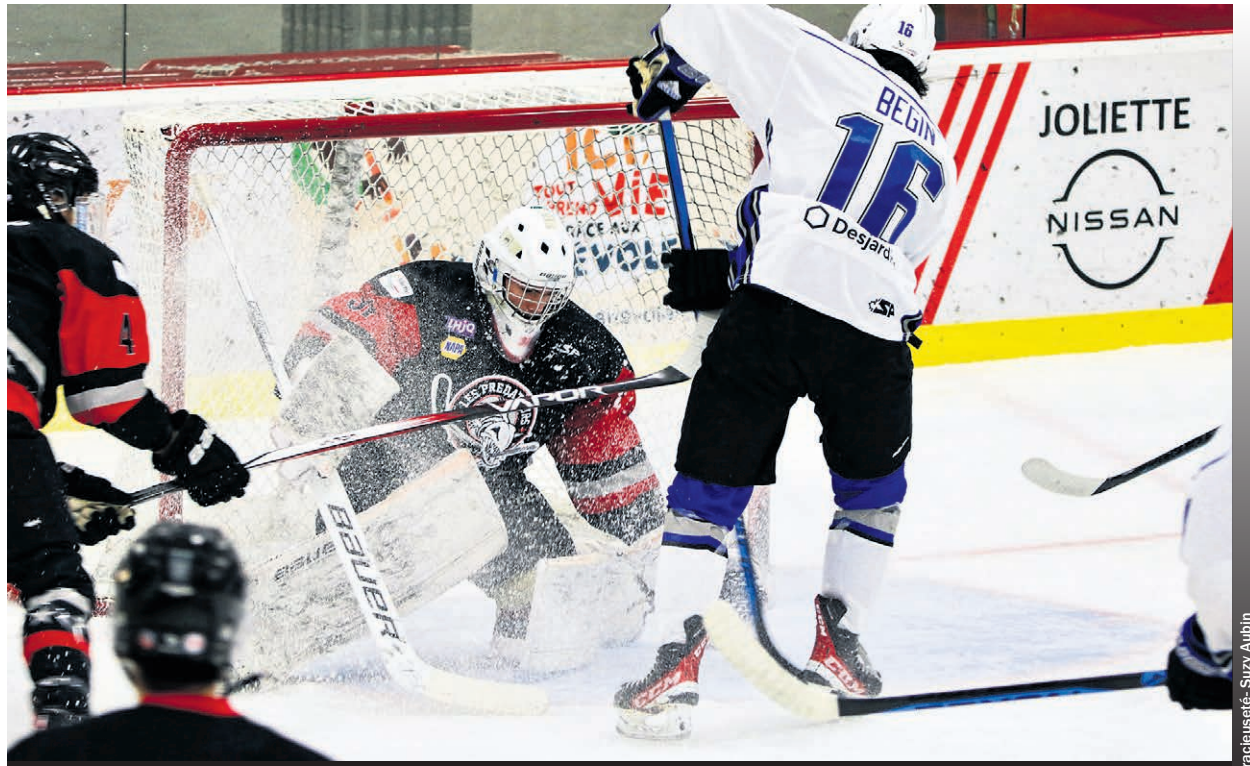
Les Prédateurs seront du côté de Granby le vendredi 26 janvier et effectueront un retour devant leurs partisans le lendemain.

La veille, les Prédateurs visitaient les Cobras de Terrebonne. Ces derniers ont entamé le match avec force et ont été les seuls à s'inscrire au tableau indicateur lors de la première période. Les Cobras ont poursuivi leur lancée au retour de