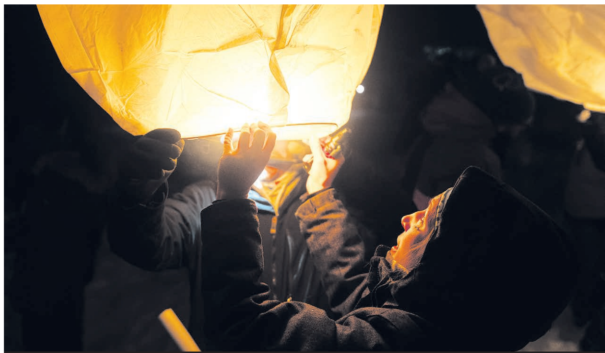
L'envolée des lanternes aura lieu sur le coup de 18h30.

La Municipalité de Rawdon tient à remercier ses précieux partenaires dans la présentation du Grand Frisson 2024.