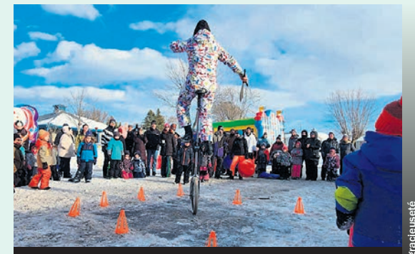
C'est un rendez-vous les 26 et 27 janvier prochains au parc Amyot.

La Municipalité a tenu à remercier ses précieux partenaires sans qui il ne serait pas possible d'organiser un événement d'une telle envergure. (MB)