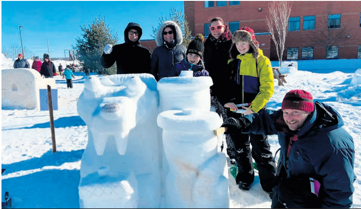
La compétition annuelle de sculpture sur neige à Sainte-Julienne est de retour le 3 février prochain.