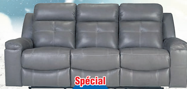
SOFA INCLINABLE 84005424