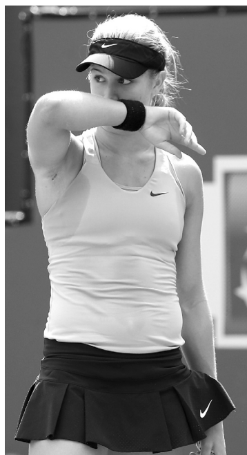
Eugenie Bouchard a semblé être surprise par son adversaire roumaine au premier set, alors que Simona Halep a rapidement pris les devants 5-0.

L'Américaine Lauren Davis a déclaré forfait avant son duel contre l'Australienne Casey Dellacqua en raison d'un problème gastro-intestinal.