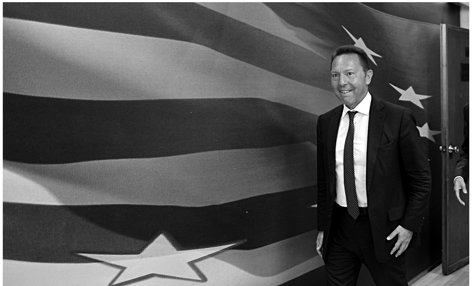
LOUISA GULIAMATI AGENCE FRANCE-PRESSE

Une norme mondiale en matière d'échanges d'informations fiscales est en préparation sous