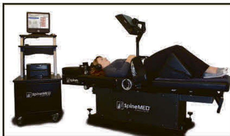
AUJOURD'HUI : la précision de l'information permet dorénavant des soins mieux ciblés, ce qui augmente la possibilité de meilleurs résultats.

Avec l'avènement des puissants ordinateurs, des logiciels complexes et des senseurs de plus en plus précis, des appareils de décompression neurovertébrale efficaces ont pu être développés. Il est dorénavant possible de décompresser de façon précise des disques affaissés et de contrer les effets de protection musculaire à l'aide de senseurs à réaction rapide.