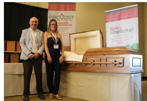
Cercueils Provost cercueilsprovost.com