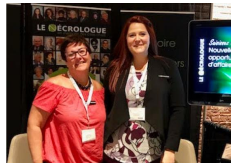
Le Nécrologue lenecrologue.com