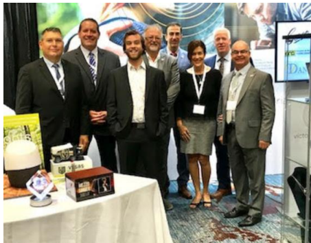
Victoriaville & Co victoriavillegroup.com