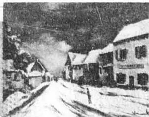
M. DE VLAMINCK (1876 - 1958) «Rue de village sous la neige», ca. 1930 Toile 32" x 39"

Le plus grand choix de peintures et sculptures au Canada. Dans la plus grande galerie marchand d'art au Canada 1438, rue Sherbrooke ouest 845-7471 et 845-7833