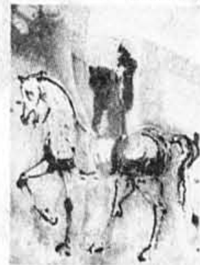
«Le Chevalier Chrétien»

3407, rue Peel, suite 1501 (angle rue Sherbrooke) MONTRÉAL ARTCO-FRANCE présente