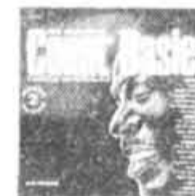
2-004050 The Best of Count Basie (2 disques) Spéc. 7.99