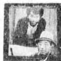
BSR-0024 MAX ROACH: Birth and Rebirth Spéc. 10.99

PRIX RÉDUITS SUR TOUS NOS DISQUES ET CASSETTES DE JAZZ (JUSQU'AU 6 JUILLET)