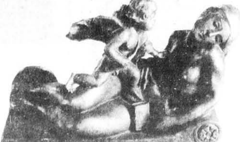
« La romanesque », d'Alfred Laliberté.

Je me disais en faisant le tour de ces sculptures qu'elles feraient la joie des psychanalystes. Toutes ces idées d'âme, de rivière, de fleur, de civilisation,