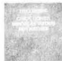
ECM-2-01232 CHICK COREA - M. VITOUS - ROY HAYNES: Trio Music Spéc. 14.99