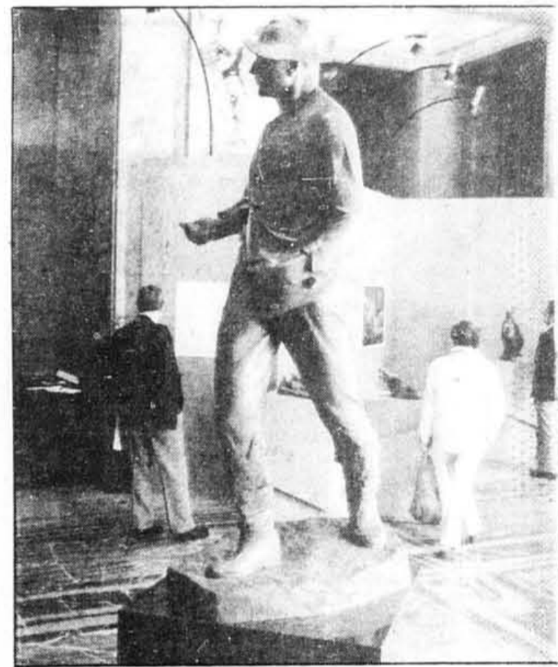
Alfred Laliberté, « Le semeur ».