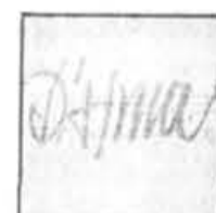
SDG-007/81 Grujão d'Alma (Brésil) Spéc. 10.99

COMPTOIR TICKETRON BILLETTS EN VENTE AU MAGASIN BERRI-STE-CATHERINE