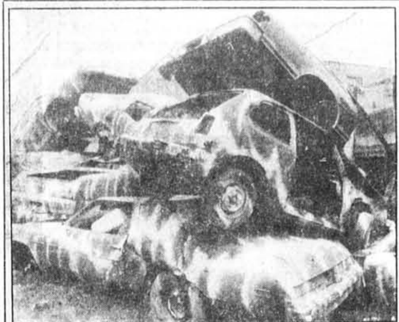
Le décor de « Titanic », une œuvre de Robert Deschênes.

Alfred Laliberté à l'Hôtel de ville de Montréal, 275 est, rue Notre-Dame. Ouvert tous les jours, de 10 h 00 à 18 h 30. Entrée libre.