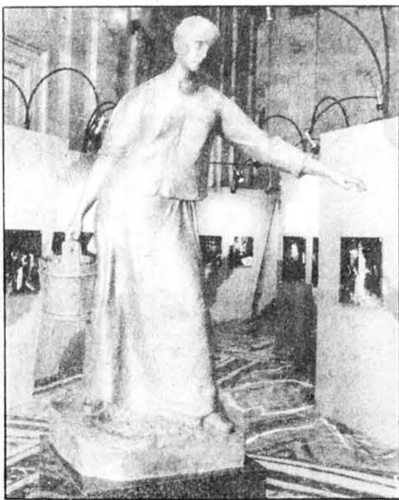
Alfred Laliberté, « La femme au seau ».