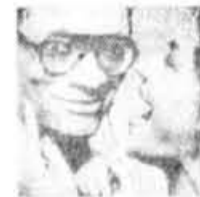
FC-39326 RAMSEY LEWIS - NANCY WILSON: The Two of us Spéc. 7.99