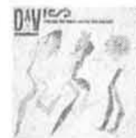
FC-38657 MILES DAVIS: Star People Spéc. 7.99