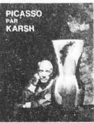
PICASSO PAR KARSH

680, rue Sherbrooke ouest Montréal (Québec) H3A 2S6 (514) 284-3768