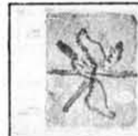
SN-1069 LEE KONITZ: Live at Laren Spéc. 10.99