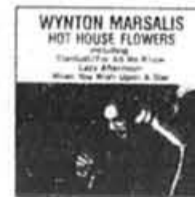
FC-39530 WYNTON MARSALIS: Hot House Flowers Spéc. 7.99