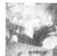
WL-021 UZEB: You be easy Spéc. 7.99