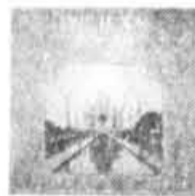
KUCK-062 PAUL HORN: Inside the Taj Mahal Spéc. 14.99

PRIX SPÉCIAUX SUR LES DISQUES ET CASSETTES DE TOUS LES ARTISTES PARTICIPANT AU FESTIVAL