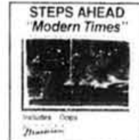
96-03511 STEPS AHEAD: Modern Times Spéc. 7.99