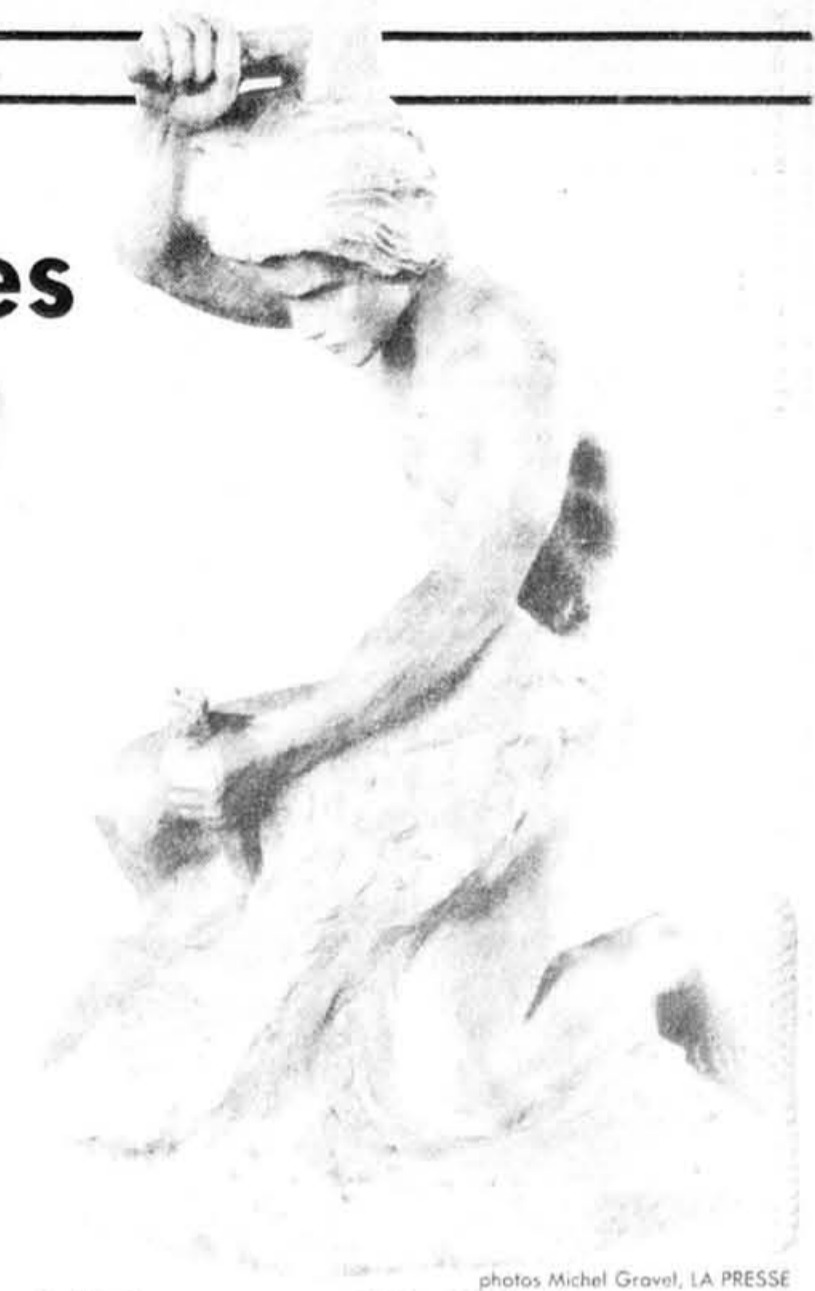
« Le fils de ses œuvres », d'Alfred Laliberté.

Un document visuel de près de dix minutes, tourné à Vérone, permet de suivre sur écran le dé-