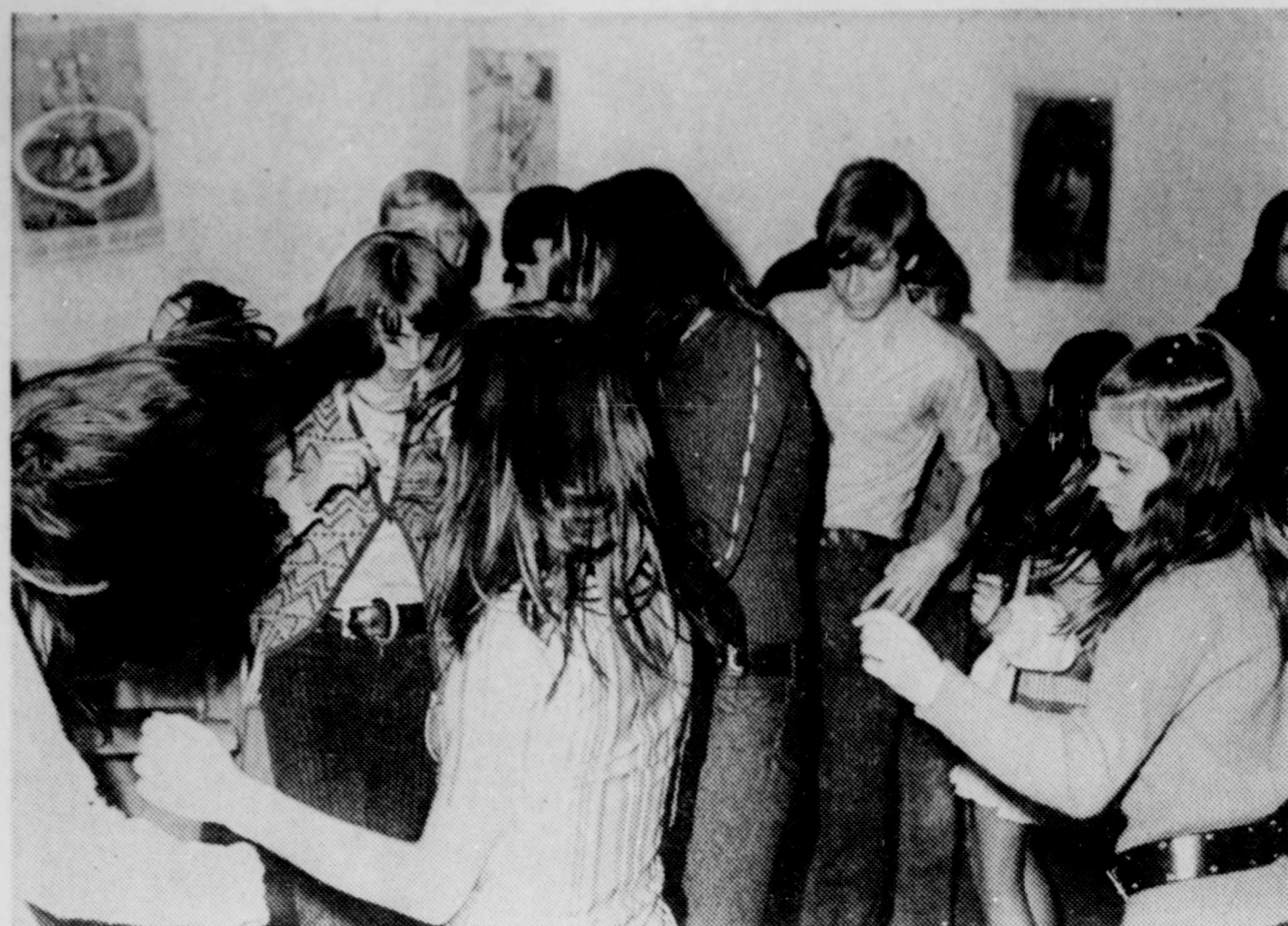
Du nouveau dans nos parcs-écoles. En effet, une discothèque a été créée dans les cadres du parc-école Cardinal-Roy et ce à la demande des adolescents (es) qui fréquen-