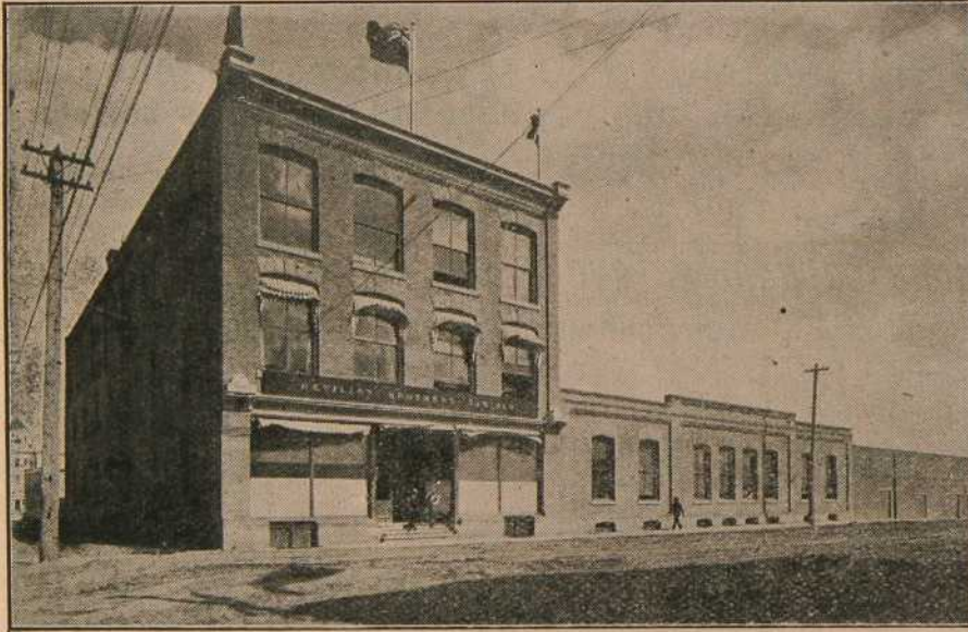
Etablissement Revillon Frères Ltée à Edmonton.