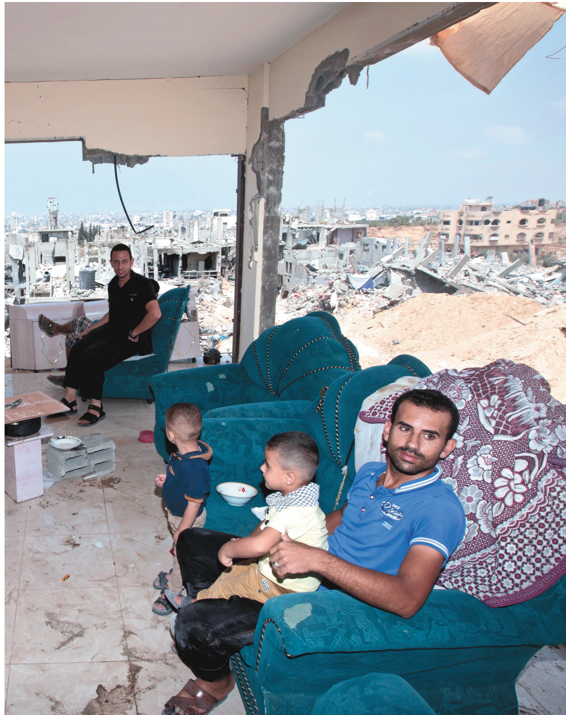
La violence envers les Palestiniens, qui se poursuit quotidiennement depuis les Accords d'Oslo, est complètement absente du récit de David Berger, dénonce l'auteur.

Le « généreux compromis » que les Israéliens ont voulu faire consiste à ne pas accaparer tous les territoires palestiniens, mais à en laisser des miettes aux habitants d'origine. Les représentants officiels palestiniens (Autorité palestinienne et OLP) avaient déjà fait un énorme compromis en reconnaissant la légitimité de