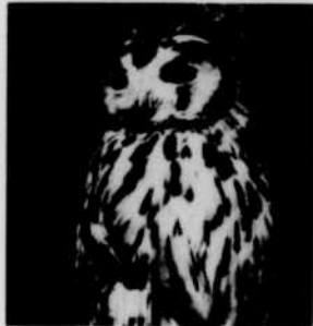
« Les Oiseaux et leur plumage varié ».