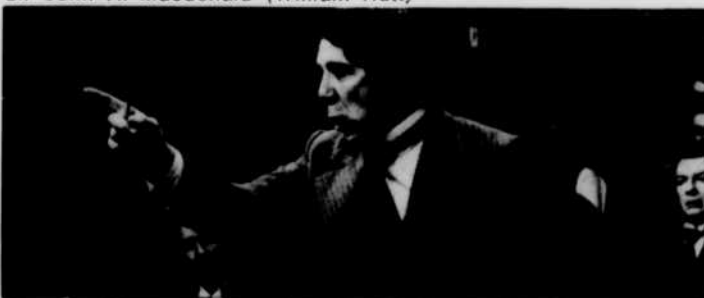
Sir John A. Macdonald (William Hutt)

Un groupe financier offrira ses services au gouvernement afin de poursuivre les travaux dans les meilleurs délais. Trois hommes puissants contrôlent cette compagnie: Macdonald garde un très mauvais souvenir de l'un d'eux, Donald Smith, qui a précipité la chute de son gouvernement cinq ans auparavant.