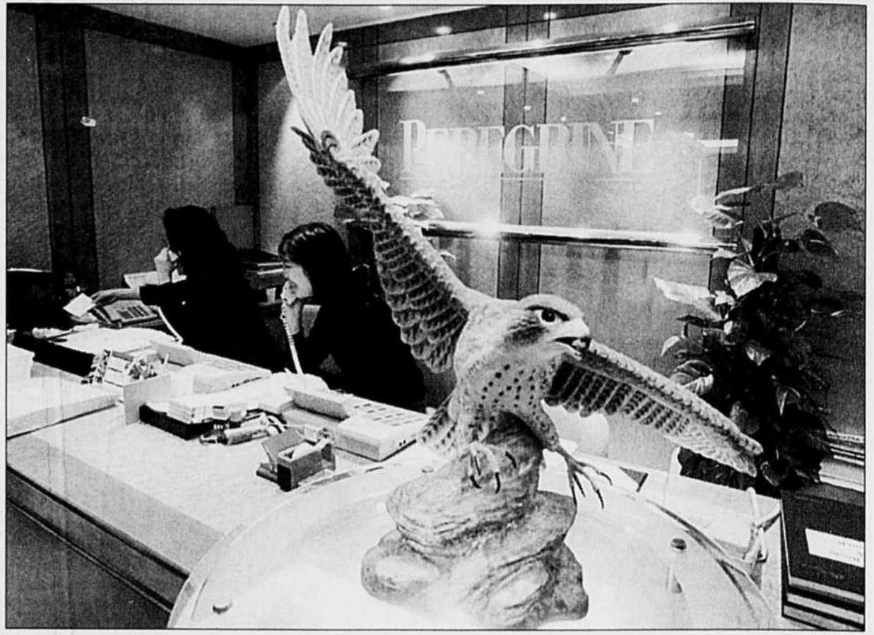
La Bourse de Hong-Kong a été minée hier par les inquiétudes suscitées par la situation de la banque Peregrine Investment Holdings.

La tourmente sur les marchés financiers asiatiques a accru la nervosité des investisseurs américains, mais nombre d'entre eux comptent sur la résistance de l'économie domestique et le faible niveau des rendements obligataires pour aider Wall Street.