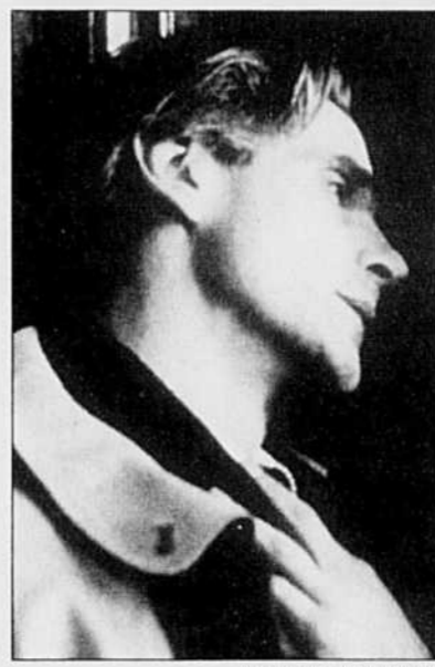
Jeremy Irons interprète le rôle de Humbert dans la dernière version de Lolita.

nation d'un cinéaste pour un roman. «On pouvait imaginer que Nabokov se trouvait dans toutes les scènes qu'il décrivait et j'ai senti que j'aurais presque pu passer directement de la page à l'écran», se souvient Lyne. «Si mon film pouvait au moins pousser le public à lire le roman de Nabokov, ce serait déjà bien. Ce livre est parfois terrifiant, parfois triste, parfois drôle et jubilatoire. En définitive, il parvient à être une extraordinaire histoire d'amour.»