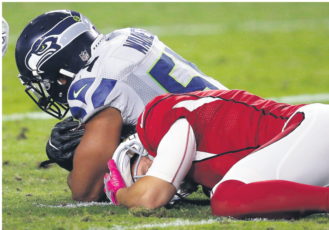
Scène d'un match sans saveur: les Seahawks de Seattle et les Cardinals de l'Arizona ont fait match nul 6-6 cette saison, le 23 octobre.

Il est par ailleurs important d'observer que certains