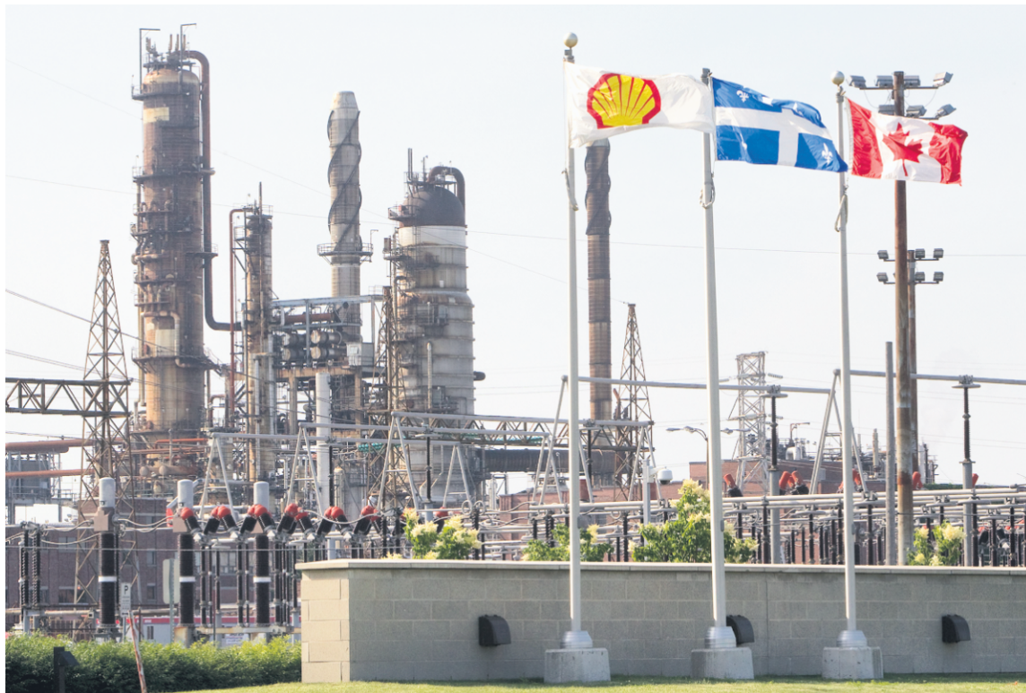
Selon des informations jamais confirmées par Shell, la pétrolière a dépensé entre 100 et 200 millions de dollars pour démanteler et décontaminer la raffinerie, qui a fonctionné de mars 1933 au 7 octobre 2010.