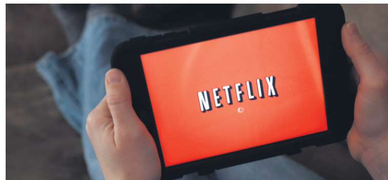
Si les jeunes ne sont pas abonnés au câble ou si les plus vieux écoutent eux aussi, à l'occasion, des émissions diffusées par Netflix et d'autres services comparables, ils ne sont pas en train de zapper et de, potentiellement, s'arrêter au hasard sur un match en cours.