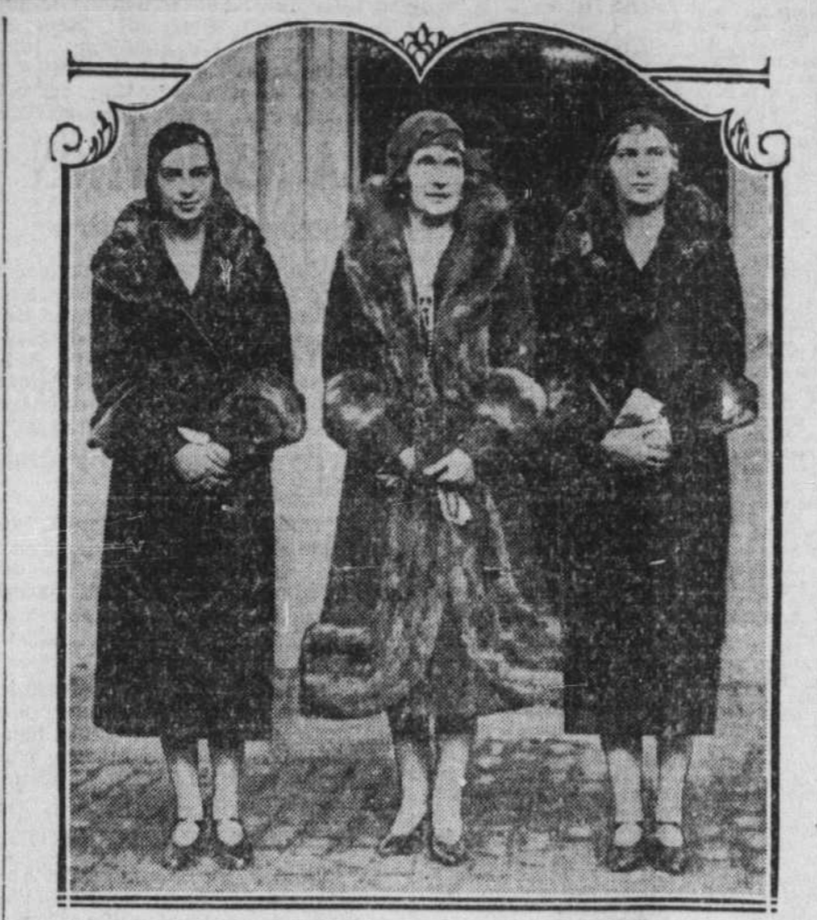
La reine d'Espagne entourée de ses deux filles, les infantes Béatrice et Maria Christiana.