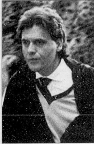
Luc Jouret, dont le corps a été identifié hier parmi les morts de Granges-sur-Salvan.

A noter enfin que le corps d'un homme et d'une femme de nationalité canadienne ont été identifiés en soirée hier. Les noms des deux victimes, qui se trouvaient dans les chalets incendiés à Salvan, n'ont cependant pas été dévoilés.