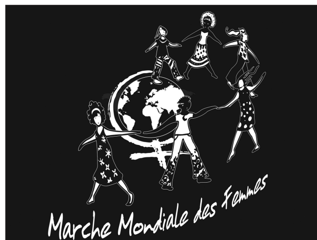
Illustration: Rouleau-Paquin design communication

par les compagnies minières à travers le monde: déplacement des populations, contamination de l'eau, etc. Et «ces minières canadiennes qui minent le droit des femmes», selon Alexa Conradi, agissent de la même manière au Québec. Pensons au Plan Nord développé sans