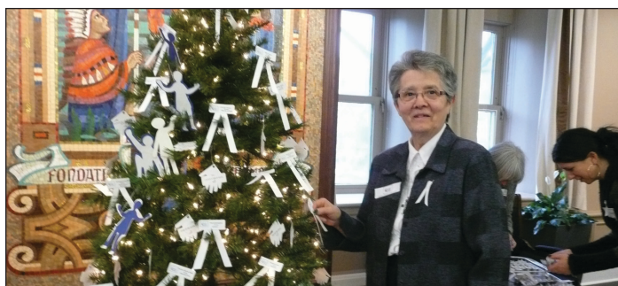
Lors opération « Tendre la main »