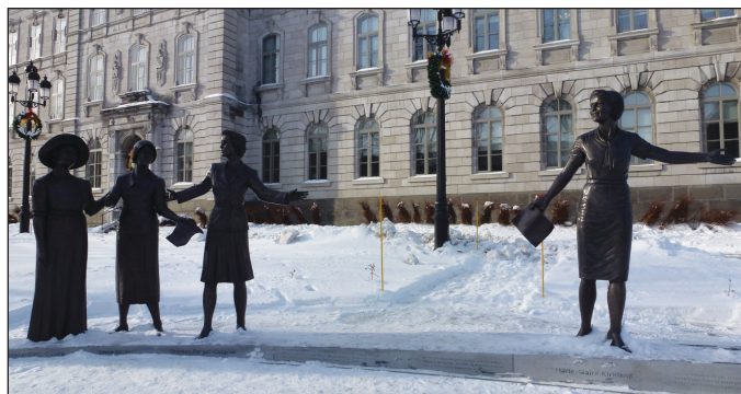
Devant l'Assemblée nationale

Saint-Jean, Marie Lacoste-Gérin-Lajoie et Thérèse Casgrain ont toutes trois milité pour le droit de vote des femmes. Marie-Claire Kirkland a été, pour sa part, la première femme élue au Parlement de Québec. L'inauguration du monument devant l'Assemblée nationale concordait avec le cinquantième anniversaire de sa nomination.