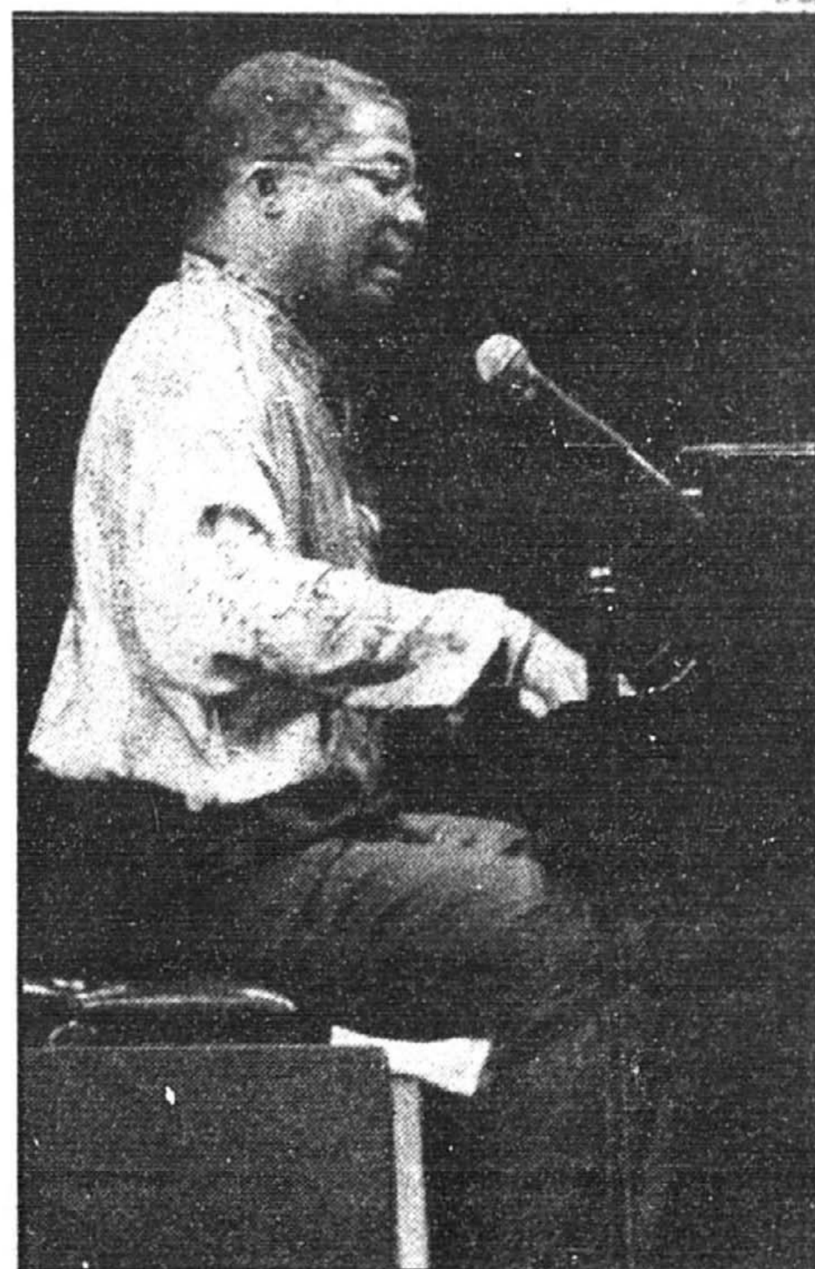
Herbie Hancock au piano hier soir à la Place des Arts.

Herbie Hancock est un grand maître du clavier, nul doute là-dessus.