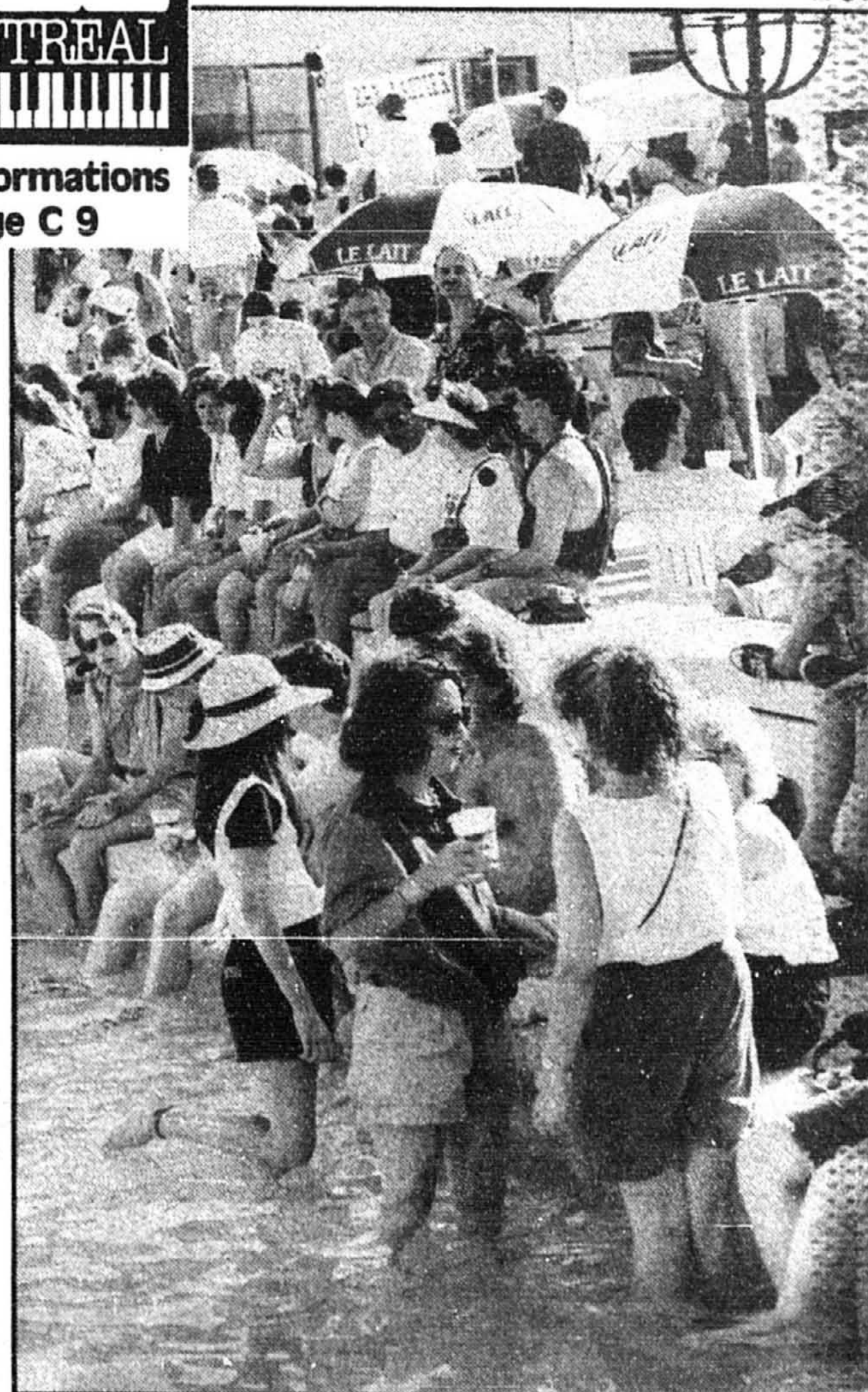
Une musique toute intérieure...

du Maurier Libé FESTIVAL INTERNATIONAL DE JAZZ DE MONTREAL Belle SPINA