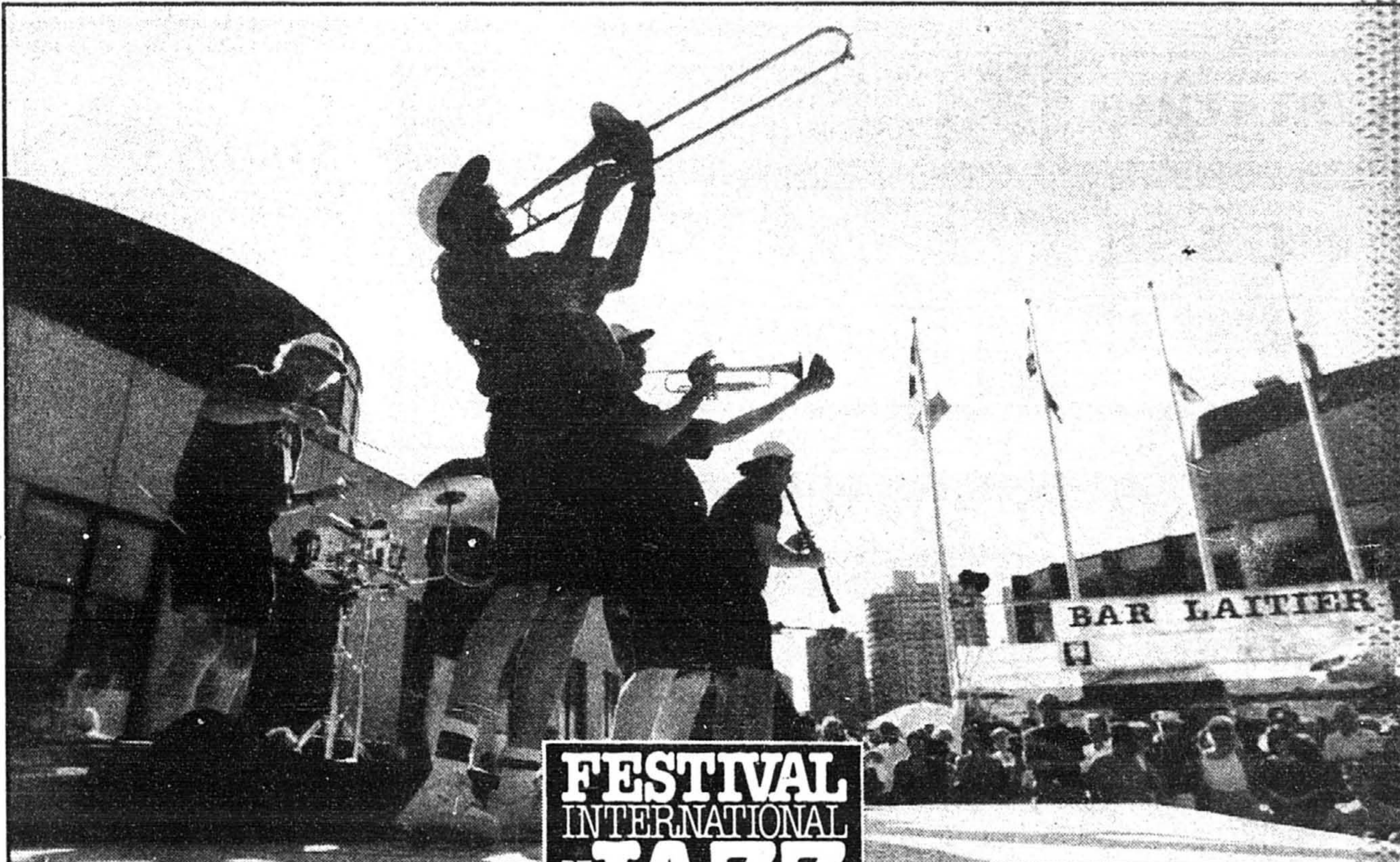
Un des groupes qui animaient hier, sous un soleil de plomb, les alentours de la Place des Arts.