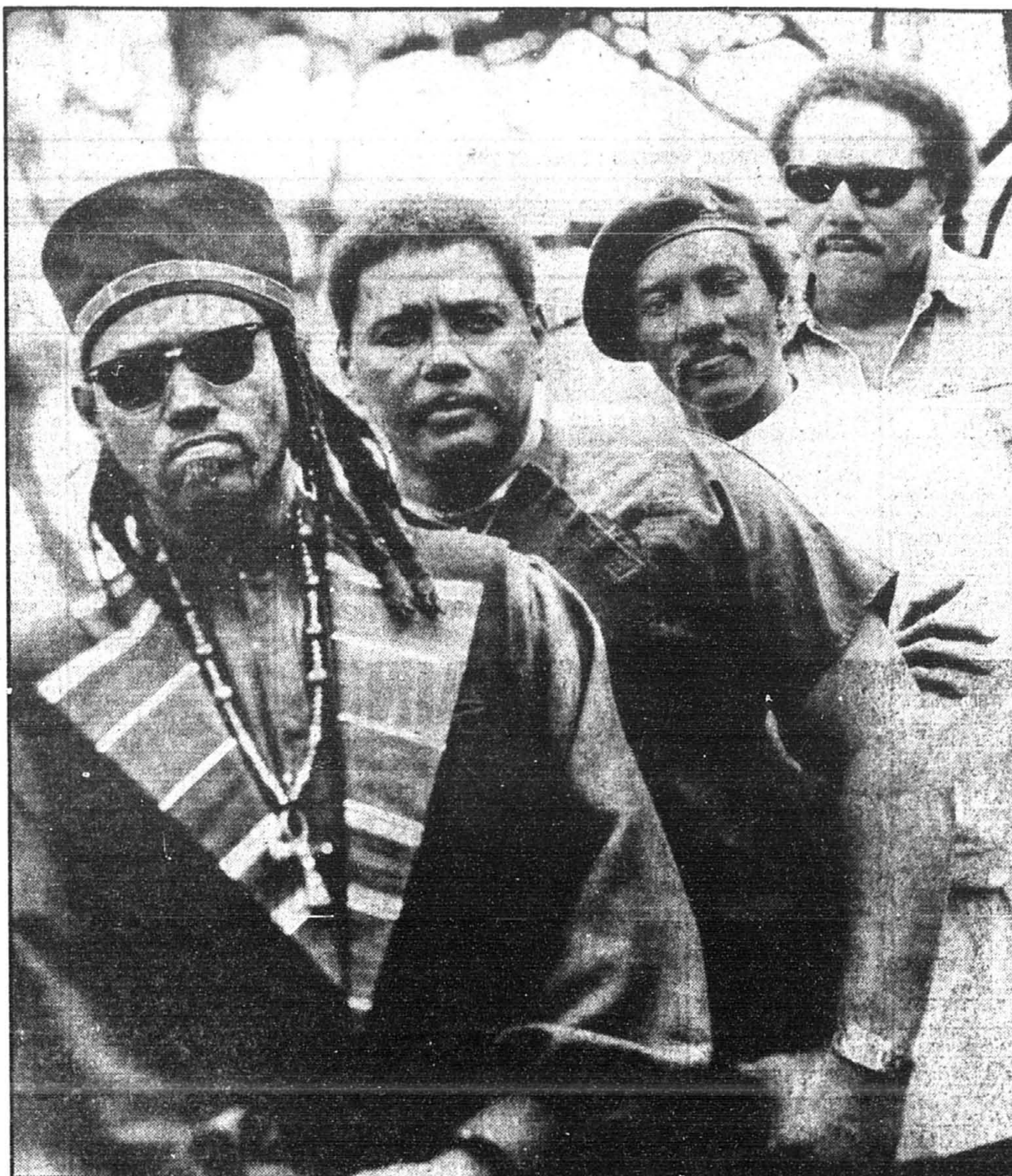
Cyril Aaron Charles Art