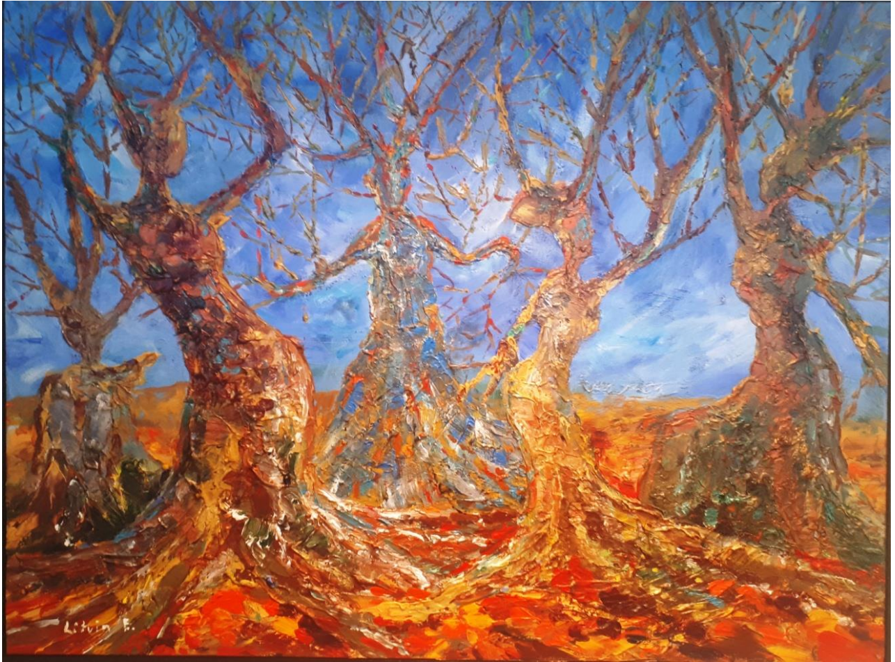
Ecatarina Livin - Into the darkness, acrylique sur toile, 80 x 60cm, 30" x 23", 2018