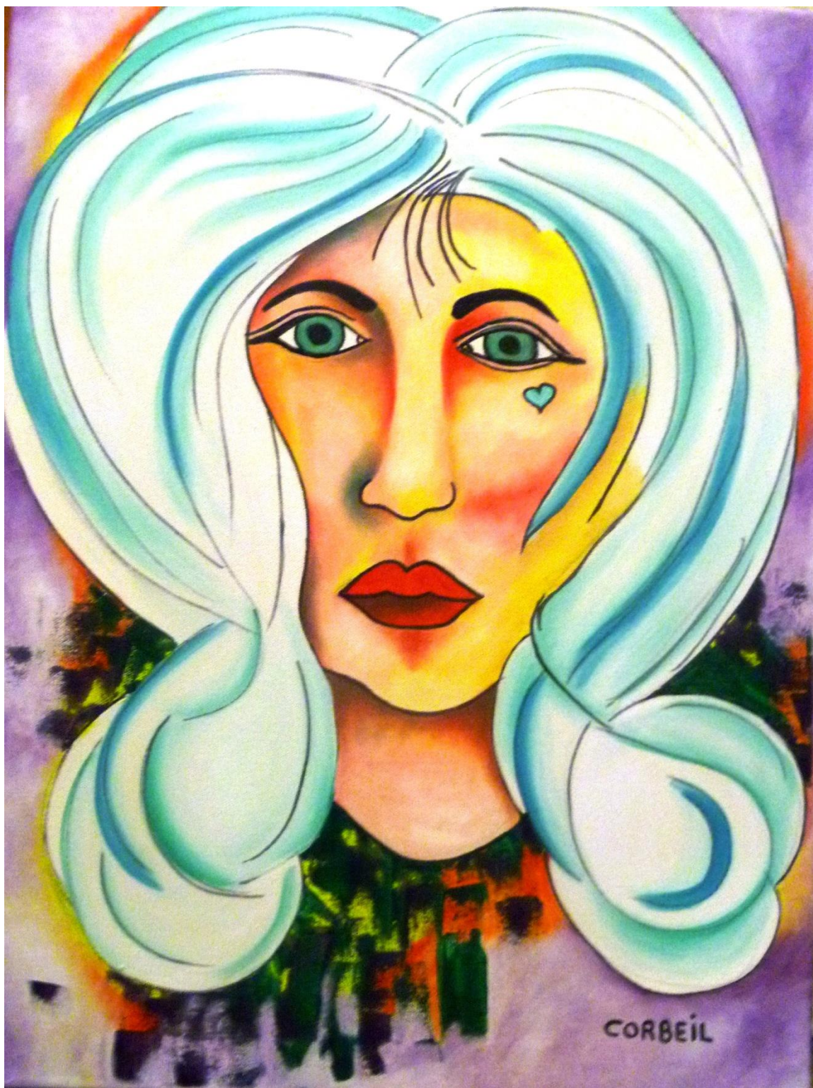
Hélène Marie Corbeil - Diva, huile sur toile, 18" x 24"