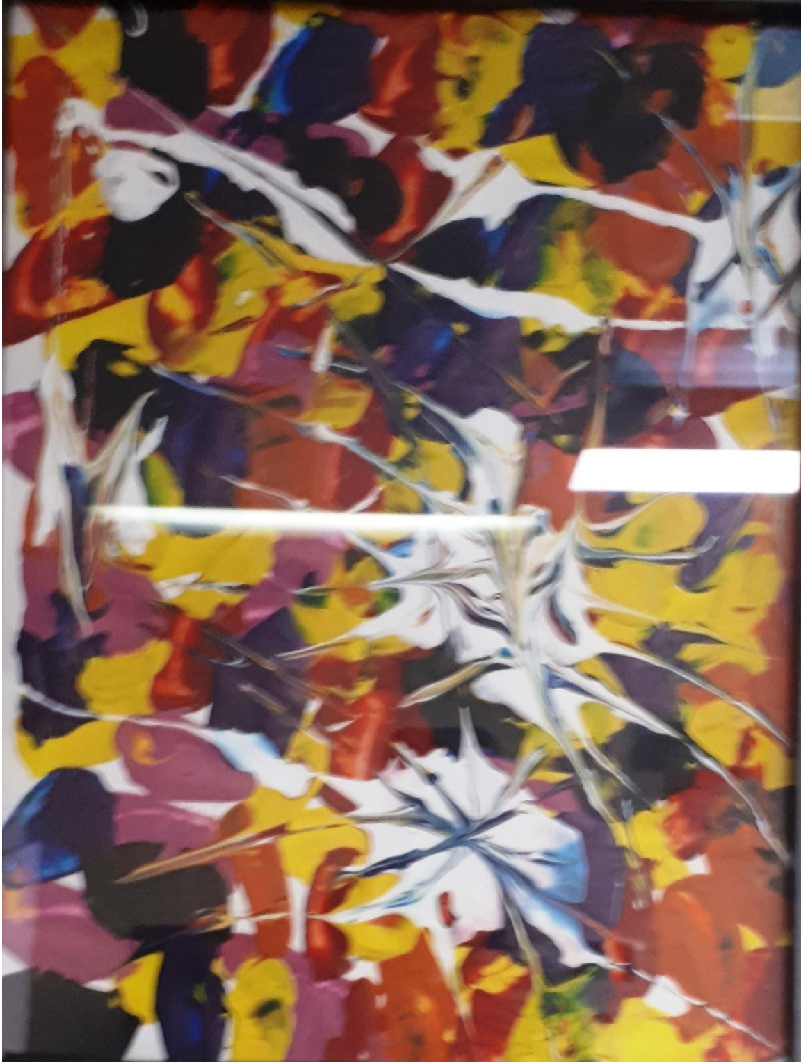
Hélène Marie Corbeil - Pulsions 1, gouache sur toile, 10" x 12"