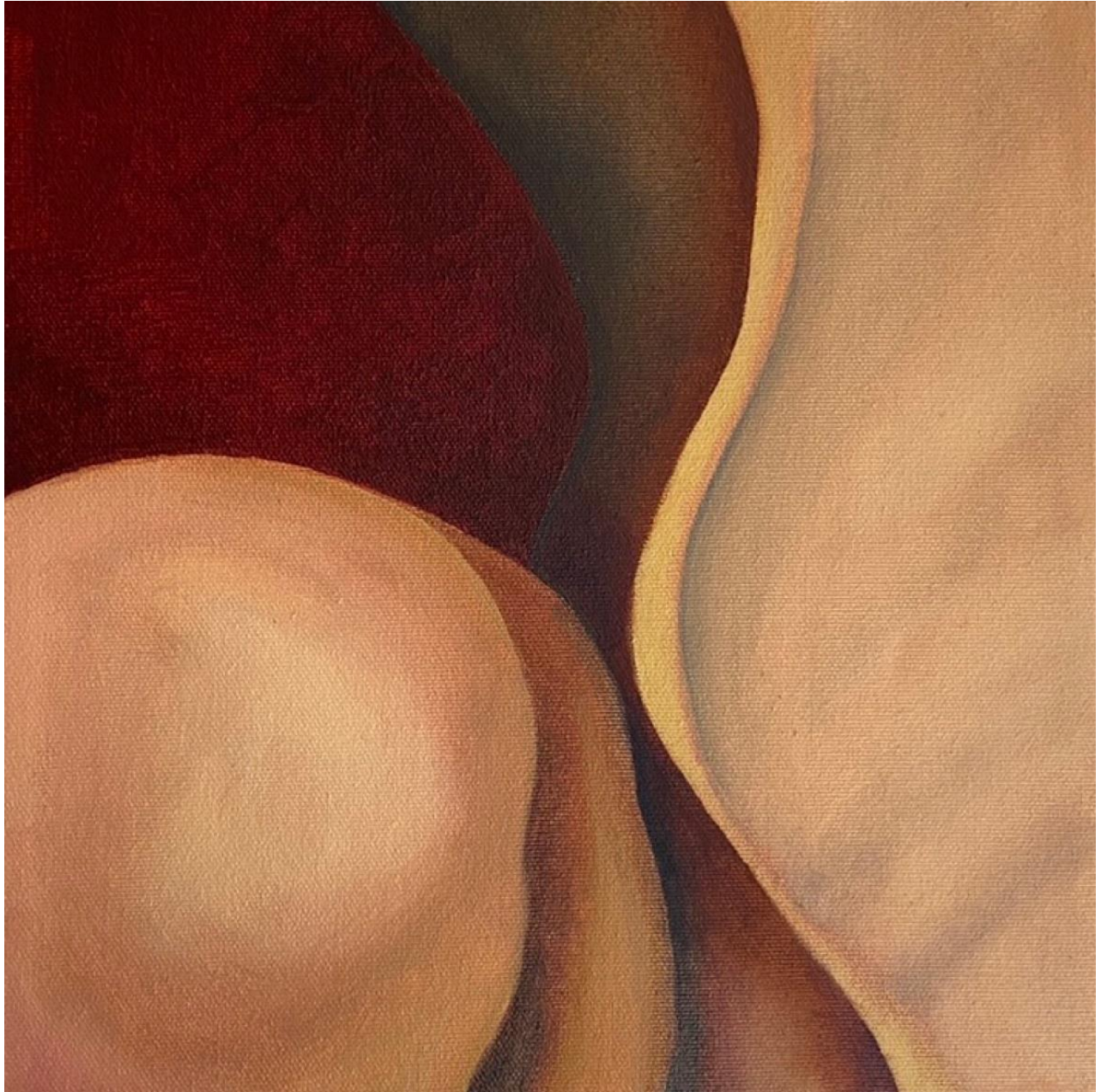
Jennifer Laoun-Rubenstein - Sans titre (rouge), huile sur toile, 10" x 10", 2020