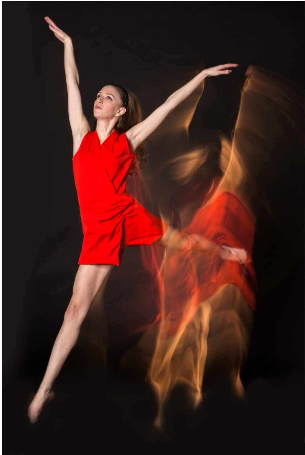
Yana Poveitysya - La dance classique 1, photographie, 8" x 11½"