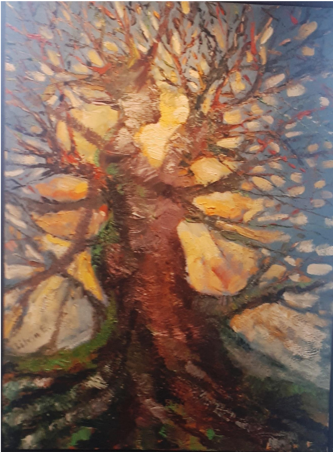
Ecatarina Livin - The dance, huile sur toile, 40" x 24", 2019