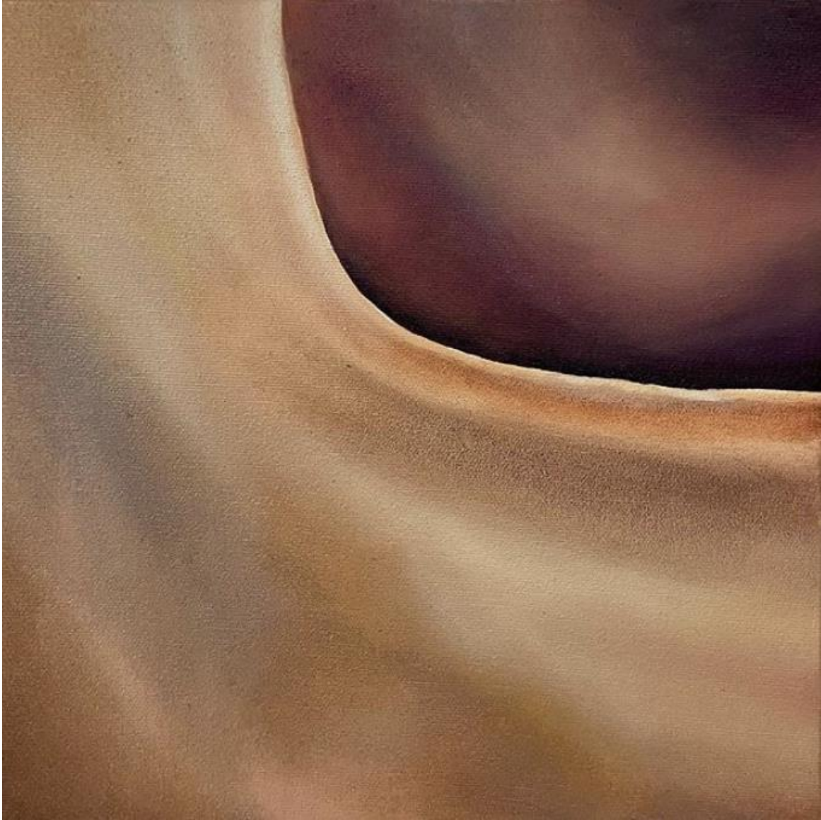
Jennifer Laoun-Rubenstein - Sans titre (brun), huile sur toile, 10" x 10", 2020