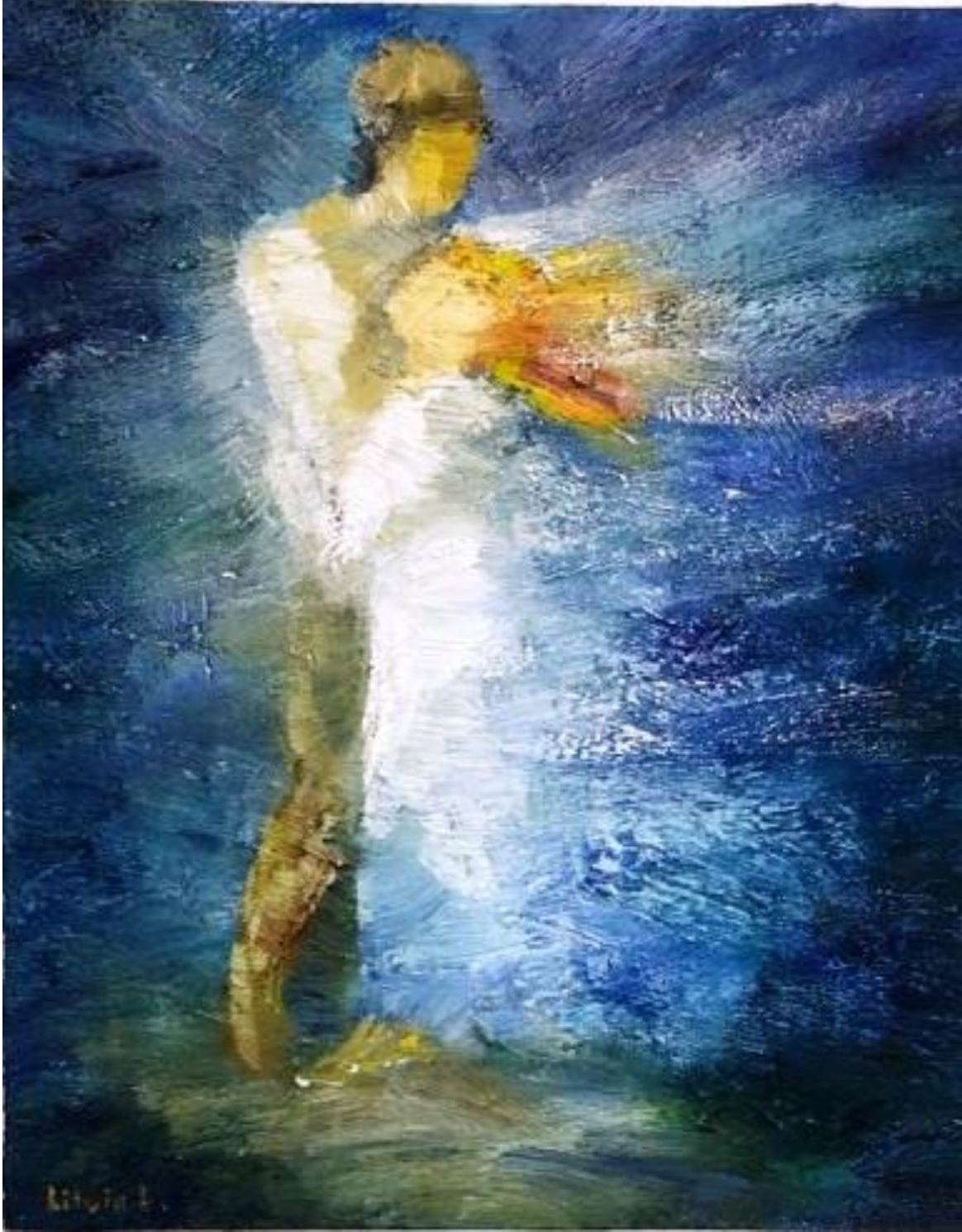
Ecaterina Litvin – Time to say goodbye, huile sur toile, 16" x 20"