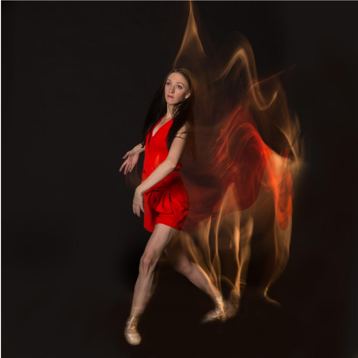
Yana Poveitysa - La dance classique 1, photographie, 7½" x 11"