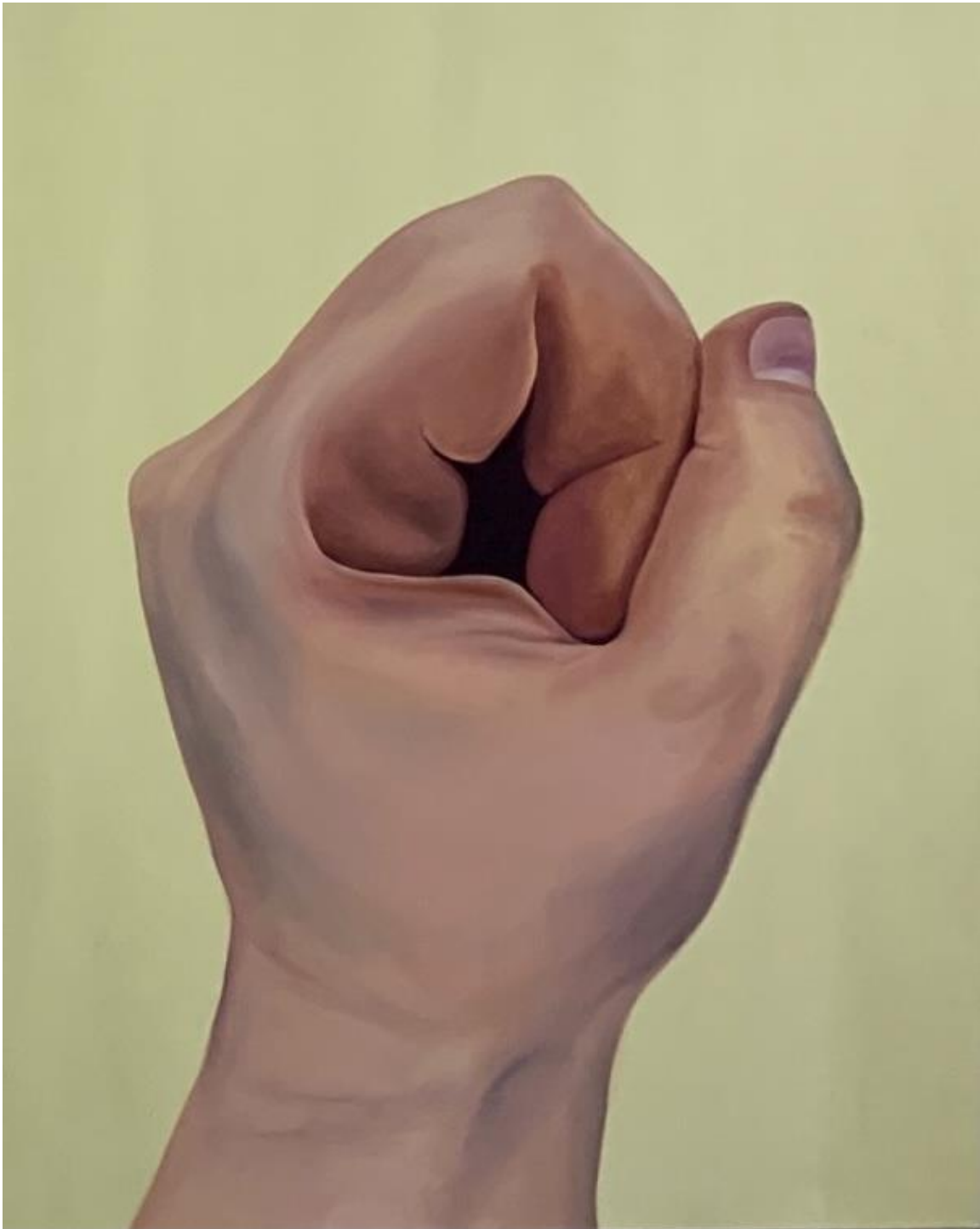
Jennifer Laoun-Rubenstein - Hand Yellow II, huile sur toile, 30" x 40", 2019