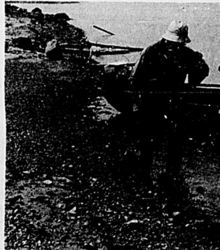
Prospection sur le bord d'un lac en Haute-Mauricie. Un examen très attentif du sol est nécessaire pour découvrir des vestiges.

Par trop inhibé et frustré, l'homme d'aujourd'hui qui se refuse à vivre comme un robot, réagit instinctivement en se repliant sur le passé qui représente pour lui un oasis de paix, un îlot de tranquillité, un havre de grâce dans un monde tourmenté. La recherche du passé, l'engouement pour le patrimoine — sous l'angle de l'historiographie — donc du refus d'un genre de vie dérisoirement vidé de tout sens que voudrait imposer un matérialisme outrancier. L'étude historique sous toutes ses formes se propose comme un antidote à trop de poisons dont on voudrait gaver l'esprit. Aimer les anciens et s'intéresser à ce qu'ils ont vécu devient pour l'homme contemporain l'une des manifestations de son complexe de survivance.