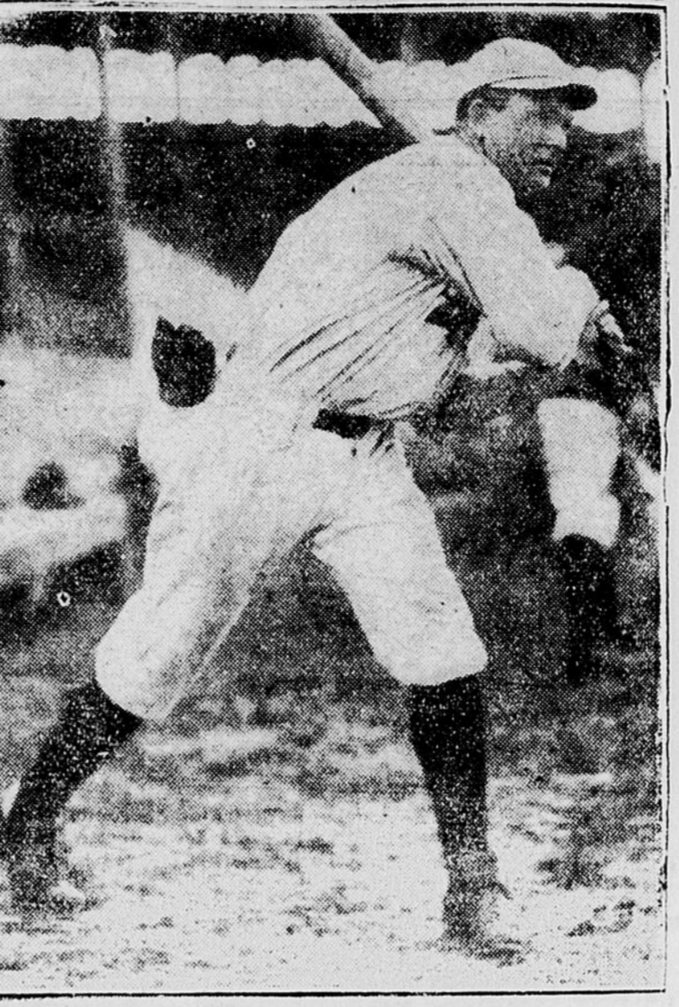
ROGERS HORNSBY, champion frappeur des ligues majeures. Il enleva la palme, avec une moyenne de .403.

LE SEGUIN A UN BEAU SUCCES M. BRENOT UN FRANC-TIREUR