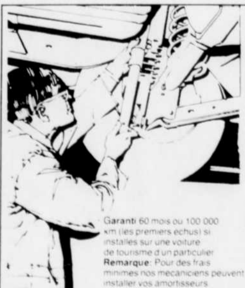
Garanti 60 mois ou 100 000 km (les premiers échus) si installés sur une voiture de tourisme d'un particulier. Remarque: Pour des frais minimes nos mécaniciens peuvent installer vos amortisseurs.

Commandes téléphoniques acceptées Centre de l'auto. Rayon 28