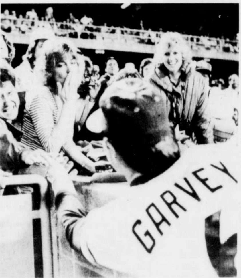
L'ex-Dodger Steve Garvey, maintenant avec les Padres de San Diego, a eu droit à tout un accueil à son retour à Los Angeles, en fin de semaine.

Comme Woodie Fryman ne pourra officiellement revenir au jeu avant le 1er mai, les amateurs montréalais auront sûrement le temps de découvrir le tout dernier joueur produit par les filiales des Expos. Comme ceux qui couvraient les activités des Expos à l'entraînement ont découvert un releveur naturel, qui garde la balle basse et qui semble avoir la qualité de tirer les siens d'impassé quand la situation l'exige.