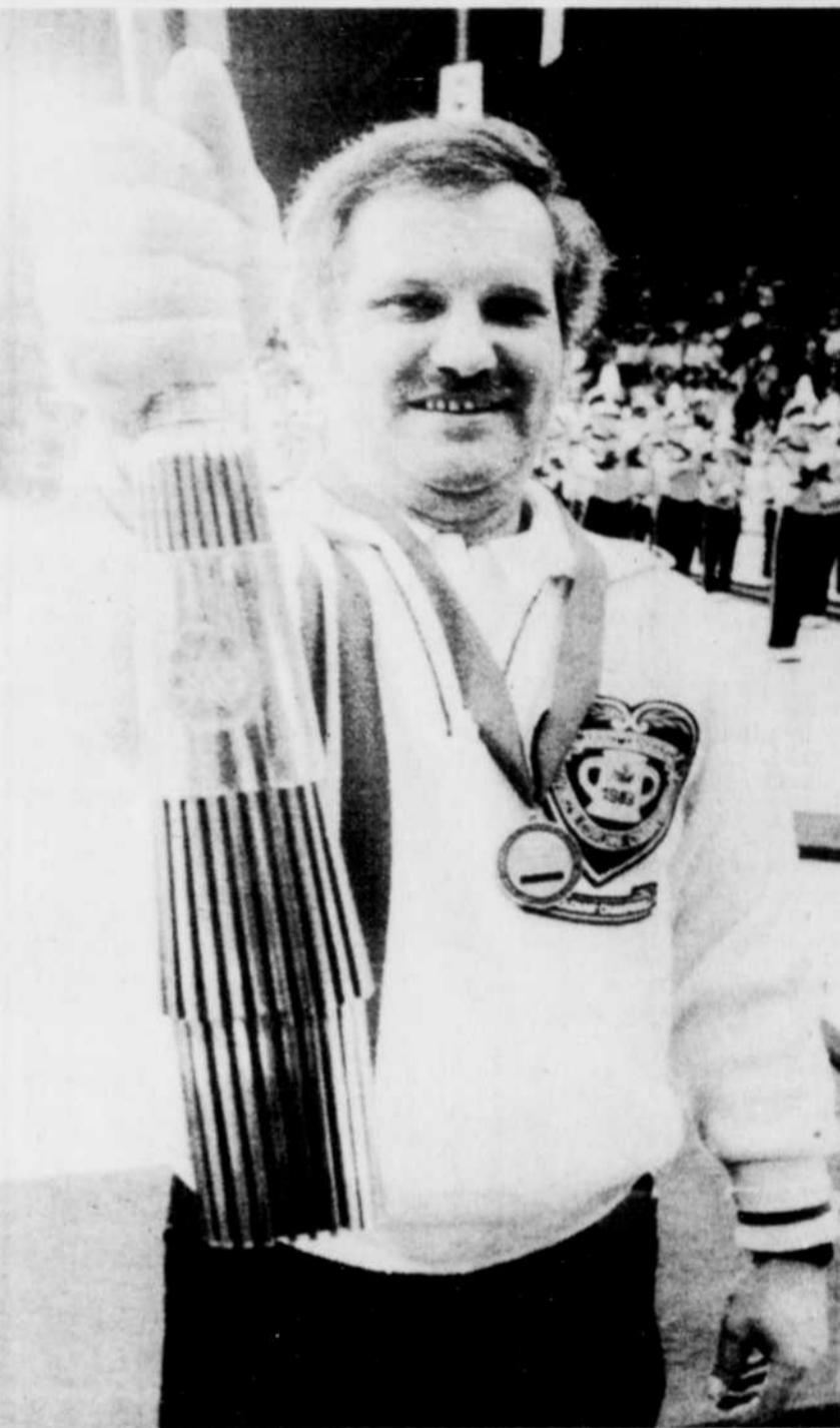
Le skip Ed Werenich du Canada exhibe fièrement le balai d'argent